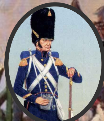
2. Французский солдат