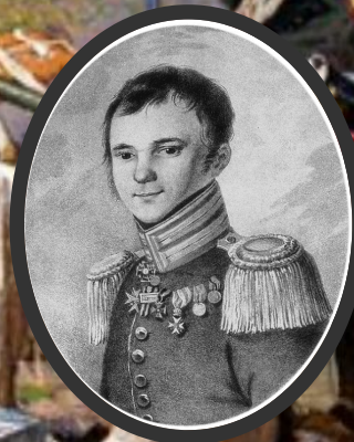
3. Русский офицер Ф.Н.Глинка