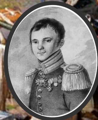
3. Русский офицер Ф.Н.Глинка