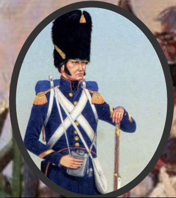
2. Французский солдат