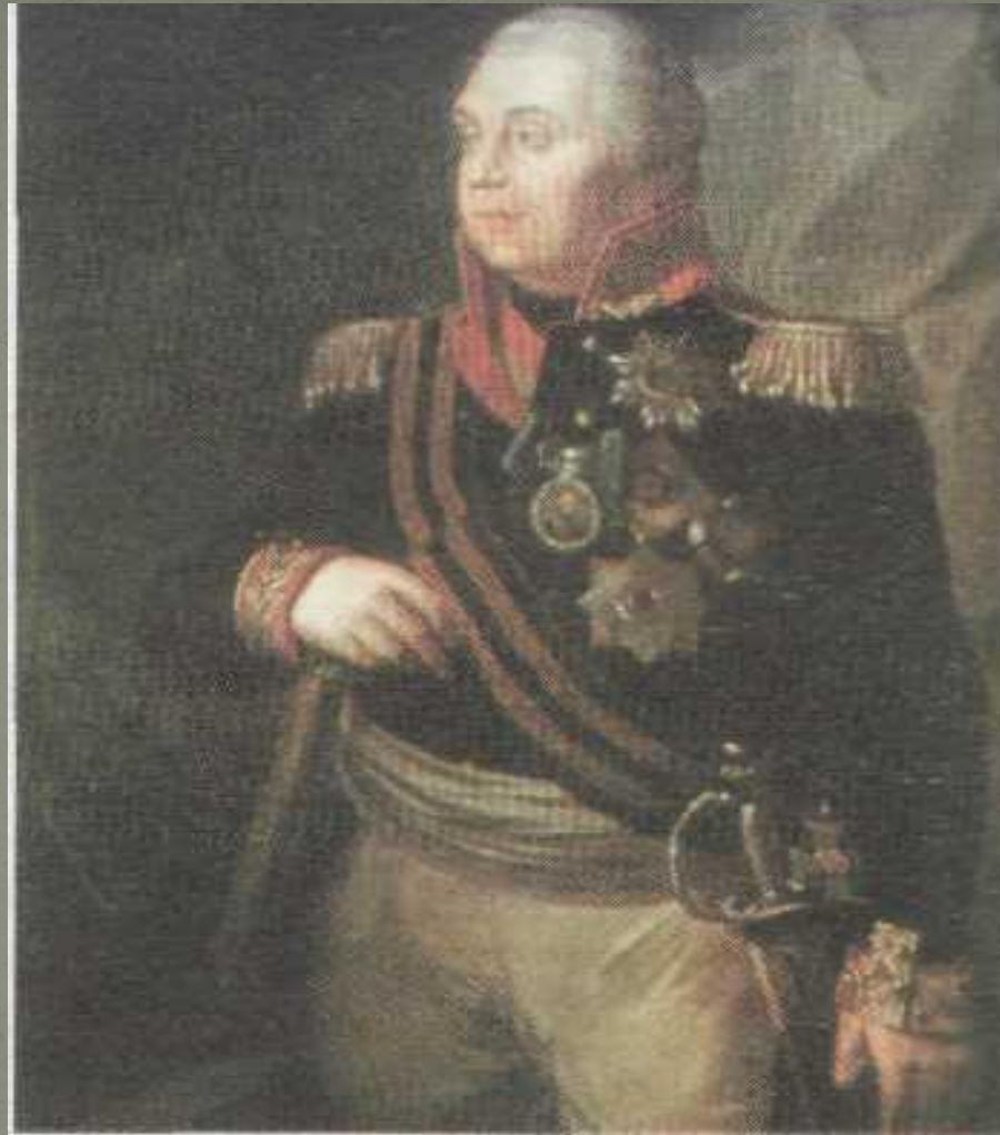
М.И. Кутузов (1745-1813)