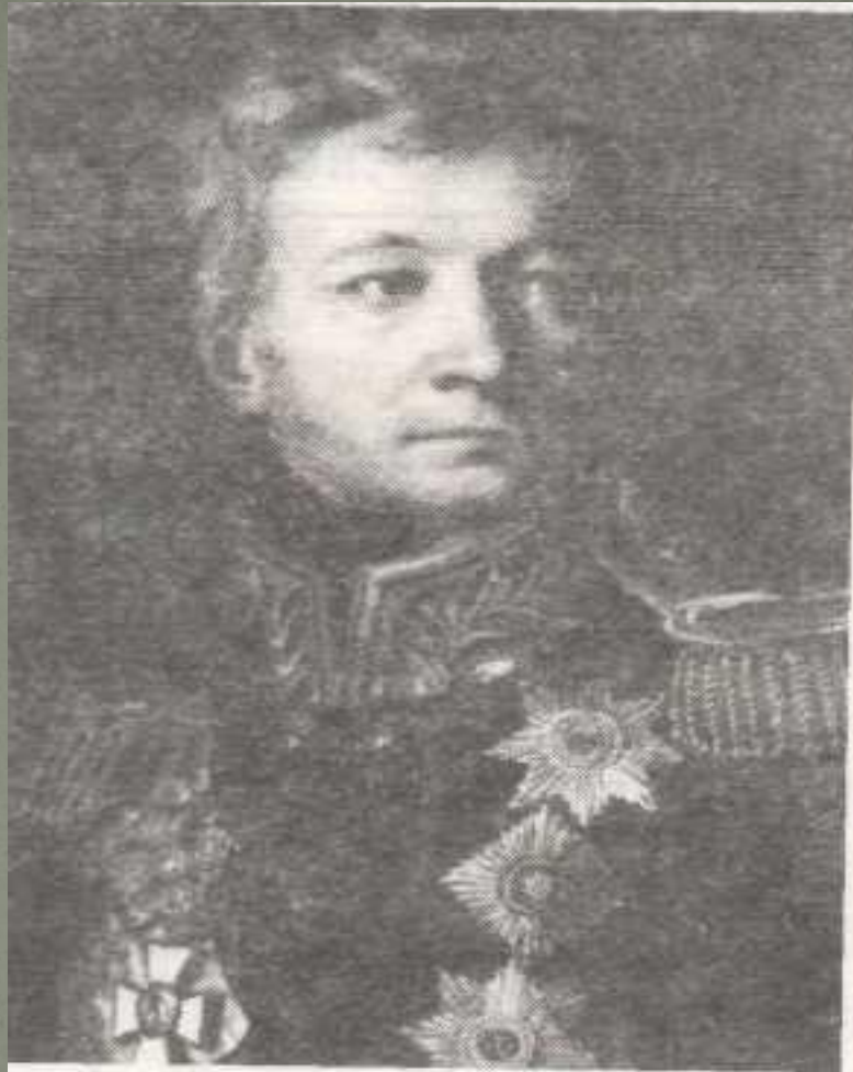
А.П. Тормасов (1752-1819)