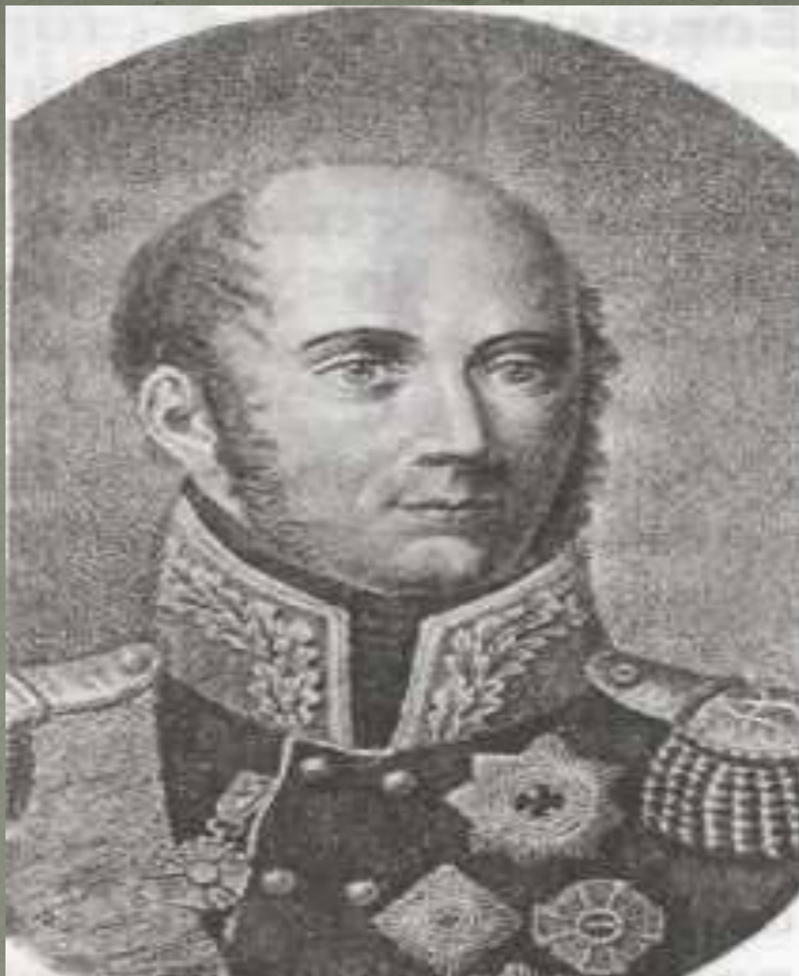
М.Б. Барклай де Толли (1761-1818)