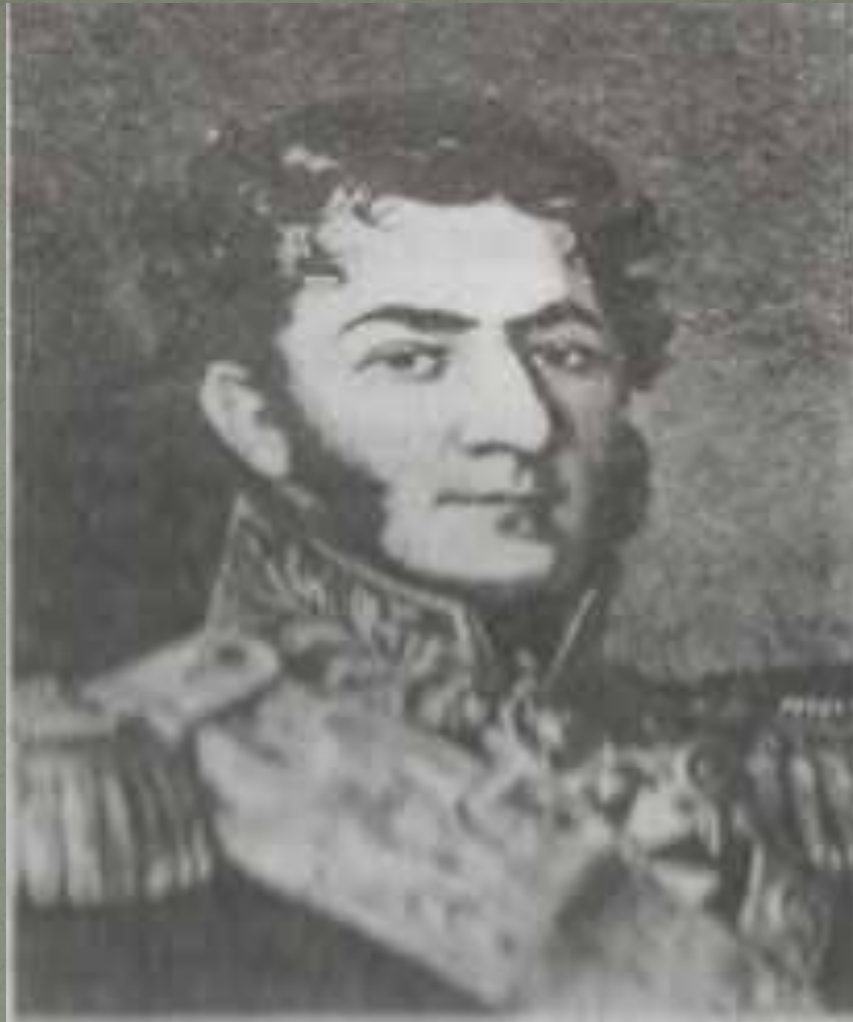
П.И. Багратион (1765-1812)