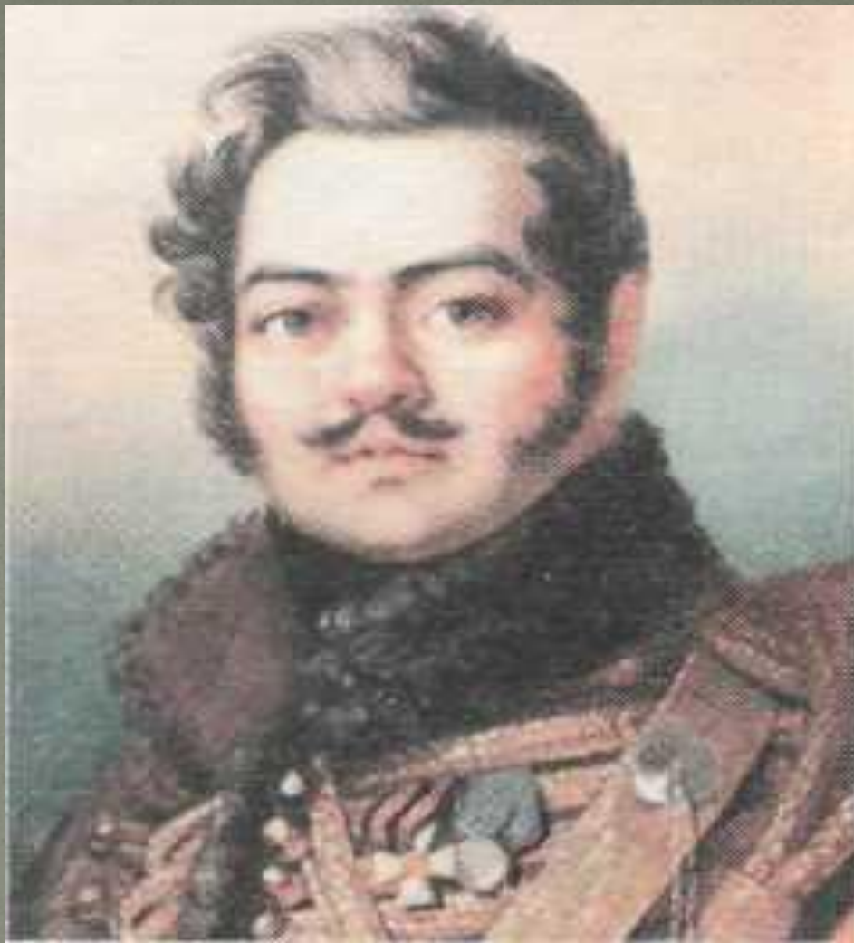
Д.В. Давыдов (1784 – 1839)