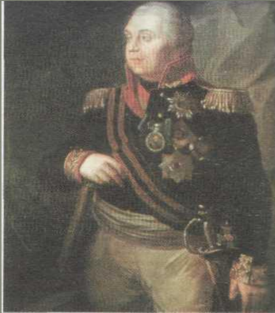
М.И. Кутузов (1745-1813)