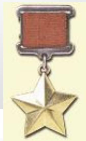
Медаль "Золотая Звезда"