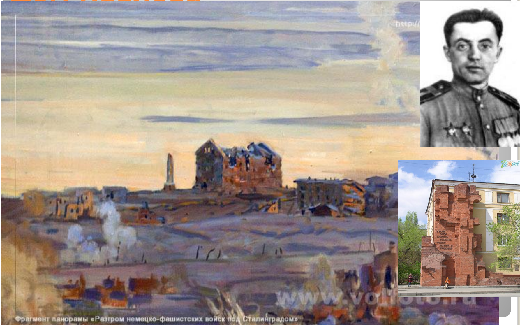
Фрагмент панорамы «Разгром немецко-фашистских войск под Сталинградом»

Дом Павлова – дом солдатской Славы. Сейчас это жилое здание. 58 дней и ночей 25 бойцов 42 полка держали оборону здания, превратив его в неприступную крепость на Волге и не дали фашистам выйти к Волге на этом участке.