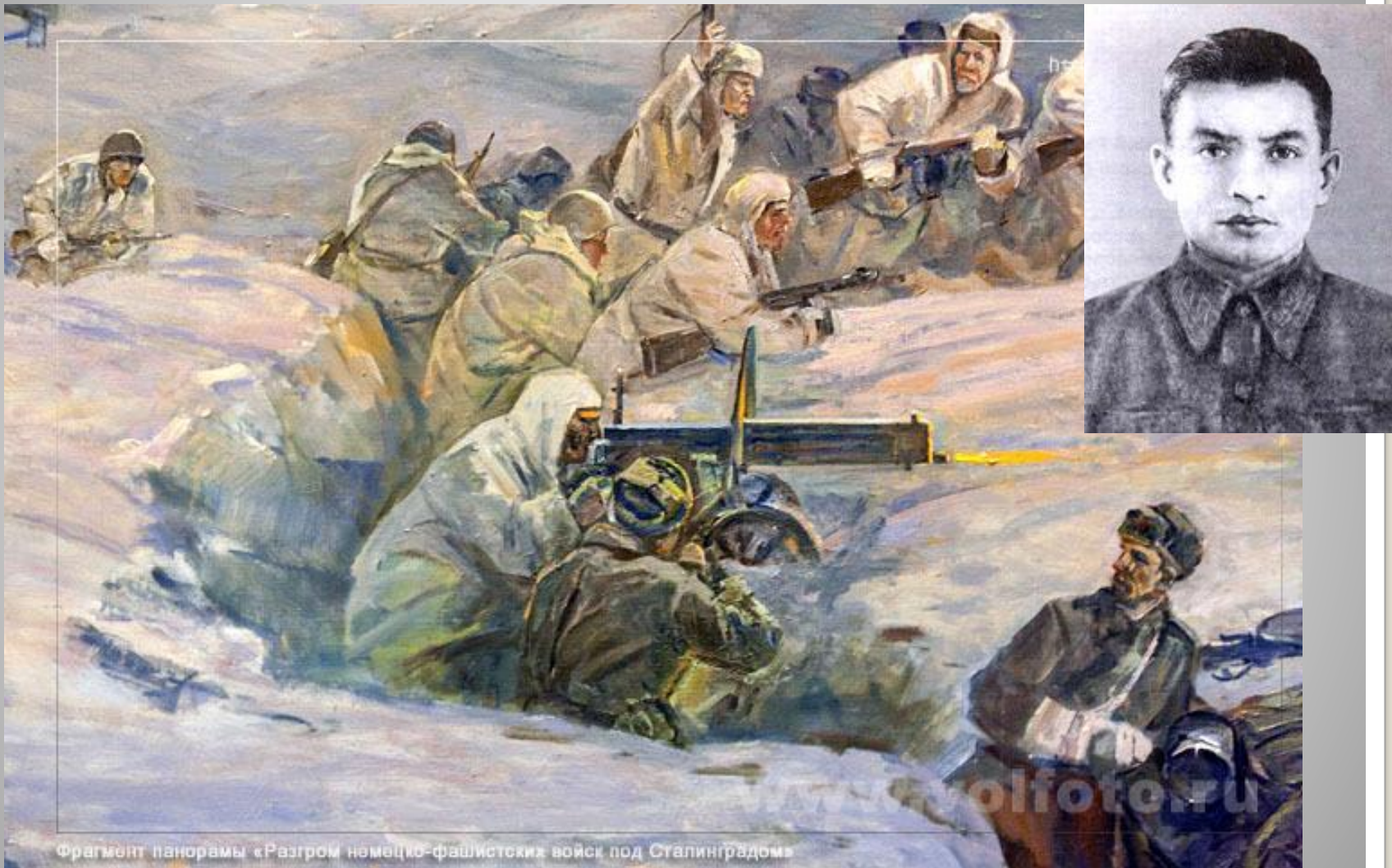
Фрагмент панорамы «Разгром немецко-фашистских войск под Сталинградом»

Пулеметчик Ханпаша Нурадилов во время боёв в районе Серафимовича в сентябре 1942 командовал пулемётным взводом. В бою 12 сентября 1942 года он был тяжело ранен, но продолжал бой, уничтожив 250 фашистов и 2 пулемёта. В этом бою Нурадилов погиб. Посмертно ему было присвоено звание Героя Советского Союза.