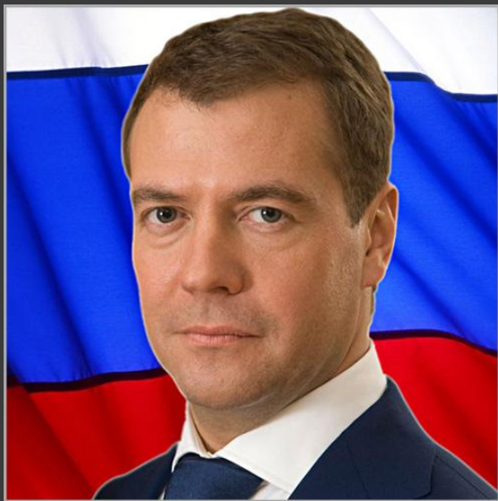
Президент России Д.А.Медведев

Указом Президента Российской Федерации Дмитрия Анатольевича Медведева присвоено почётное звание Российской Федерации «Город воинской славы».