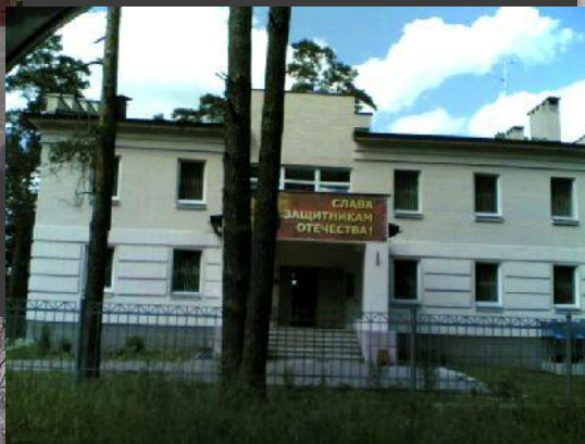
Музей Калининского фронта