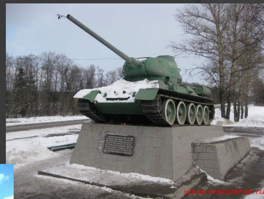
Памятник танк Т-34 находится на окраине города Твери