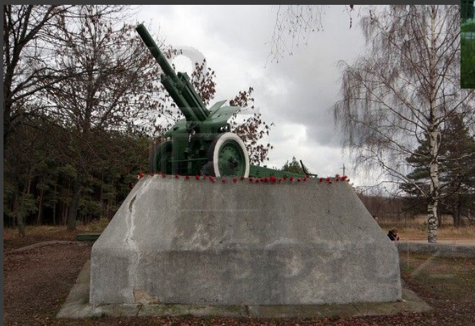
Гаубица у Бежецкого шоссе