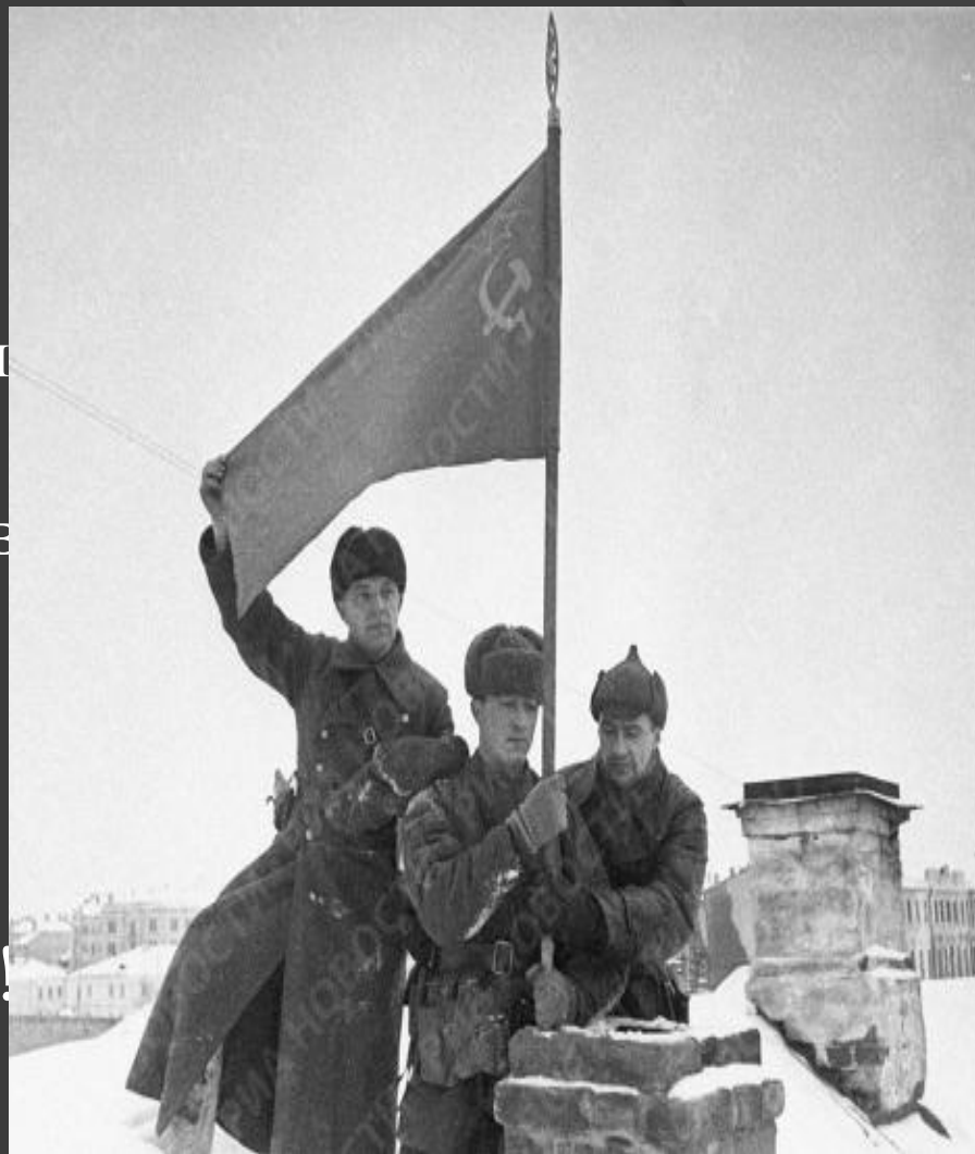
Солдаты водружают советское знамя в городе Калинине