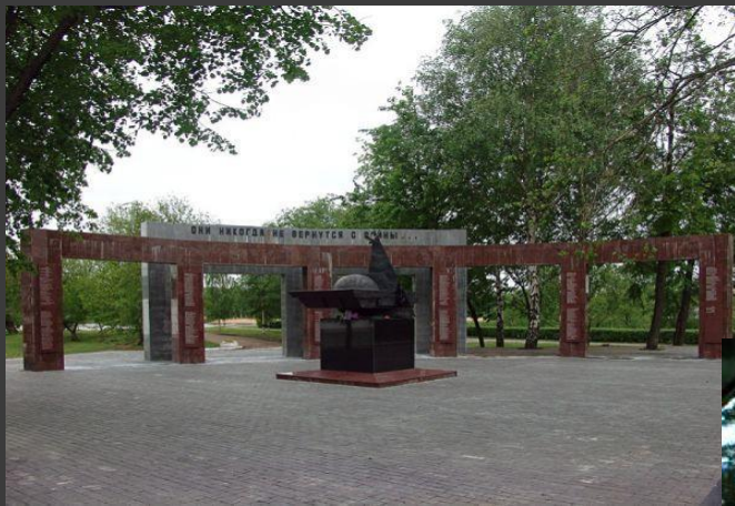
Мемориал у Обелиска Победы