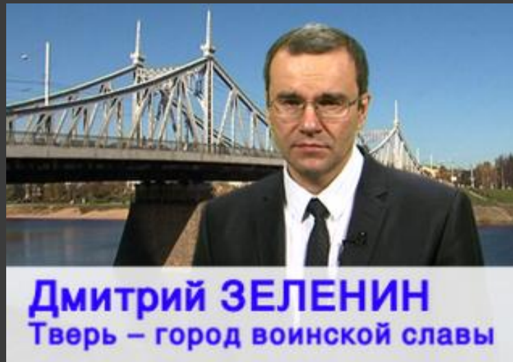
Губернатор Тверской области Д.В.Зеленин