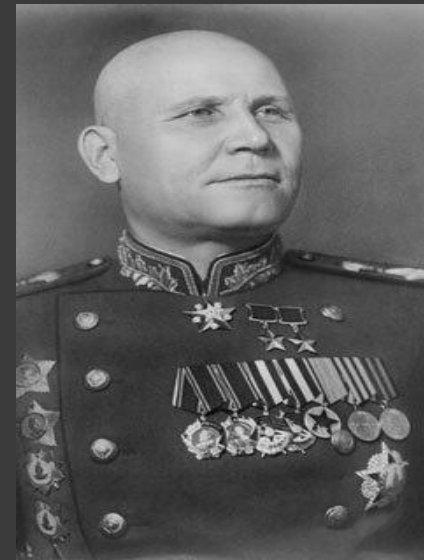
Иван Степанович Конев

5 декабря в бой пошли основные силы 31 и 29 армий. Это было одно из тех наступлений, которое в прах развеяло миф о непобедимости гитлеровской армии.