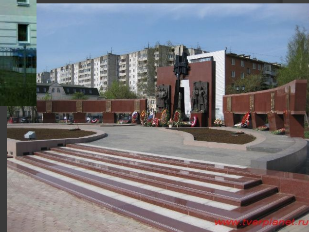
Мемориал Смоленское захоронение находится в Твери на левом берегу реки Лазурь.