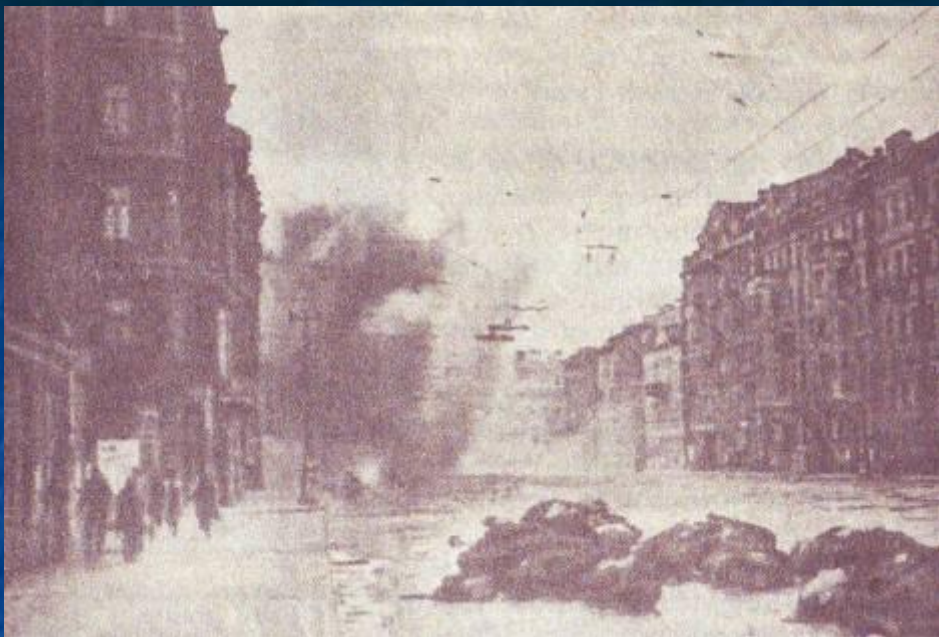
Улица Ленинграда во время обстрела