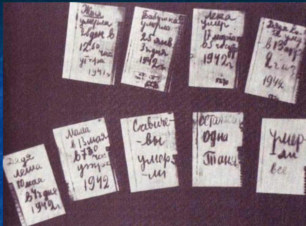
Дневник ленинградской школьницы Тани Савичевой