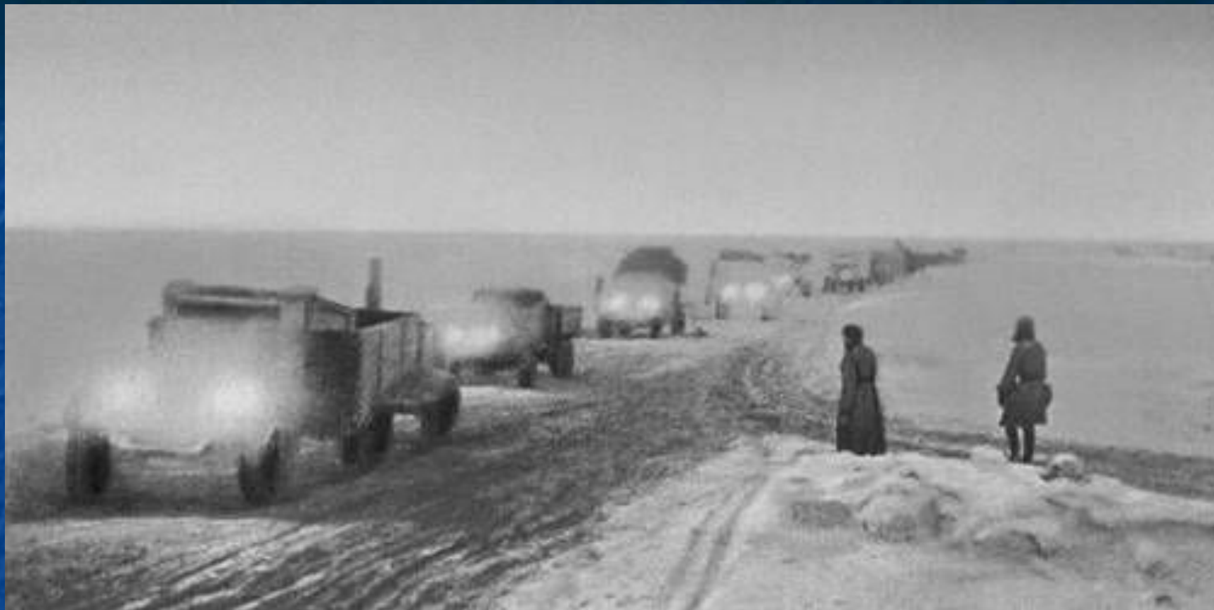
«Дорога жизни» через Ладожское озеро. 1942.