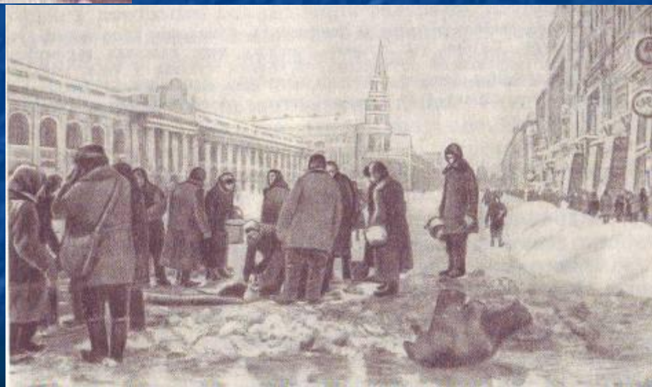
Ленинградцы берут воду из проруби