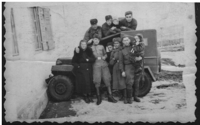
Вести с фронта от братьев

На плечи моего десятилетнего тогда дедушки легла вся мужская работа по дому, ведь он должен был стать защитой и опорой для мамы, двух сестёр и совсем маленького братишки. Но, вспоминая эти годы, он никогда не жаловался на трудности и часто повторял: « А кому тогда легко было? Главное – верить в Победу».