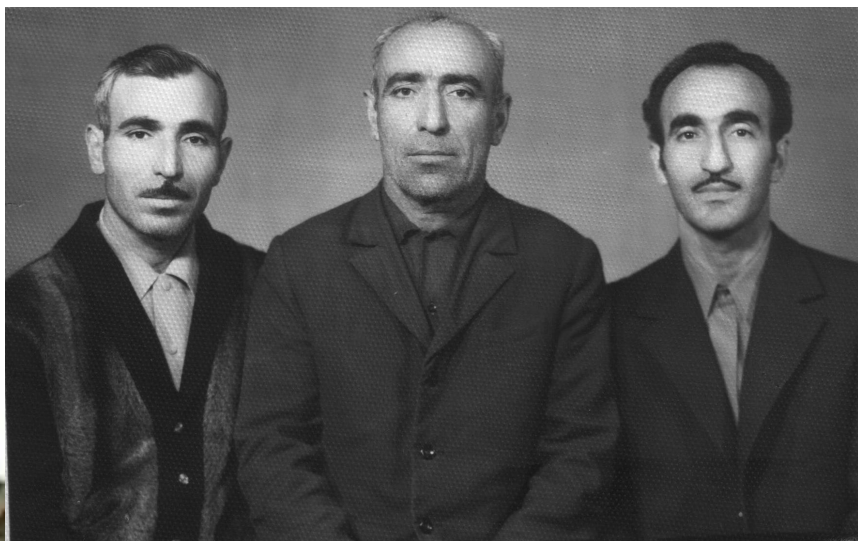
Дедушка (слева) с единственным вернувшимся с фронта старшим братом Аваком ( в центре )