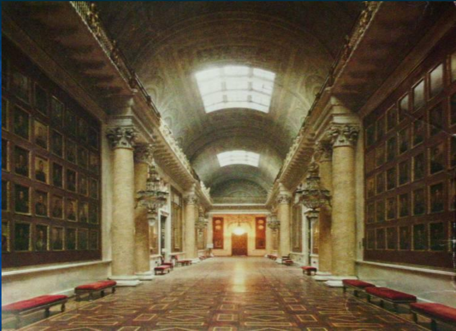
Военная галерея Зимнего дворца