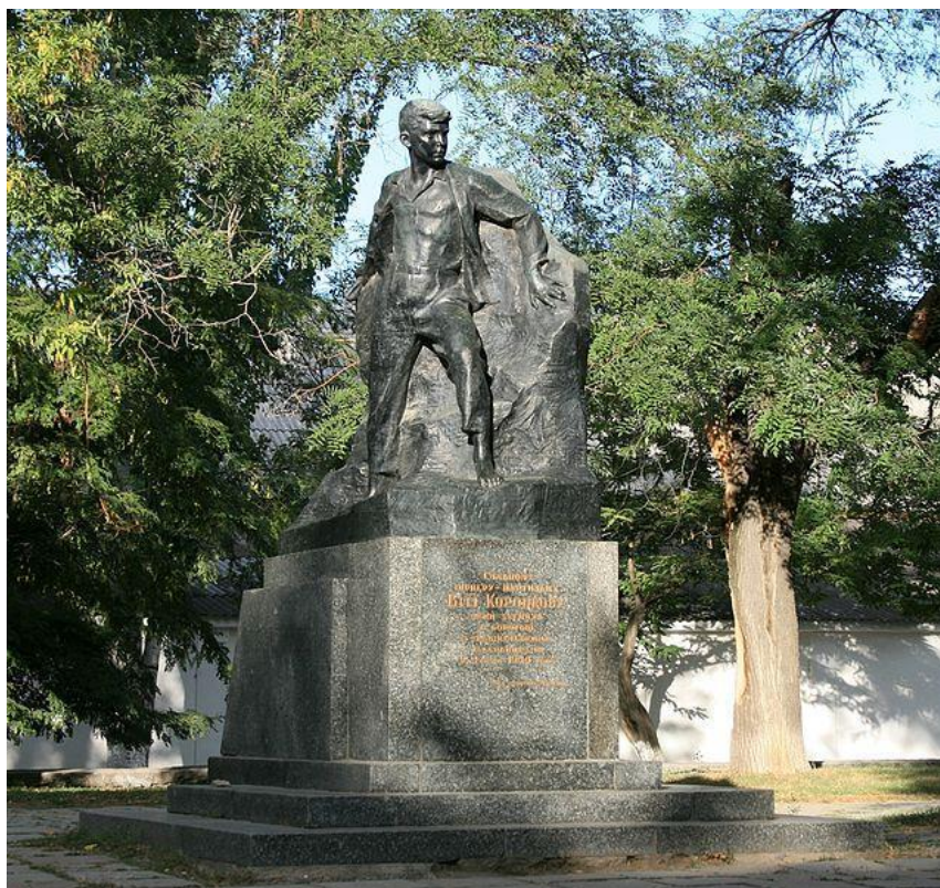
Памятник партизану Вите Коробкову в Феодосии