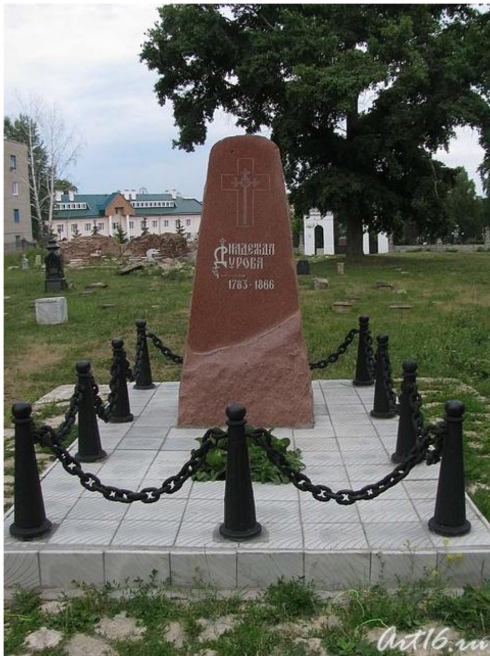
Могила Надежды Андреевны Дуровой