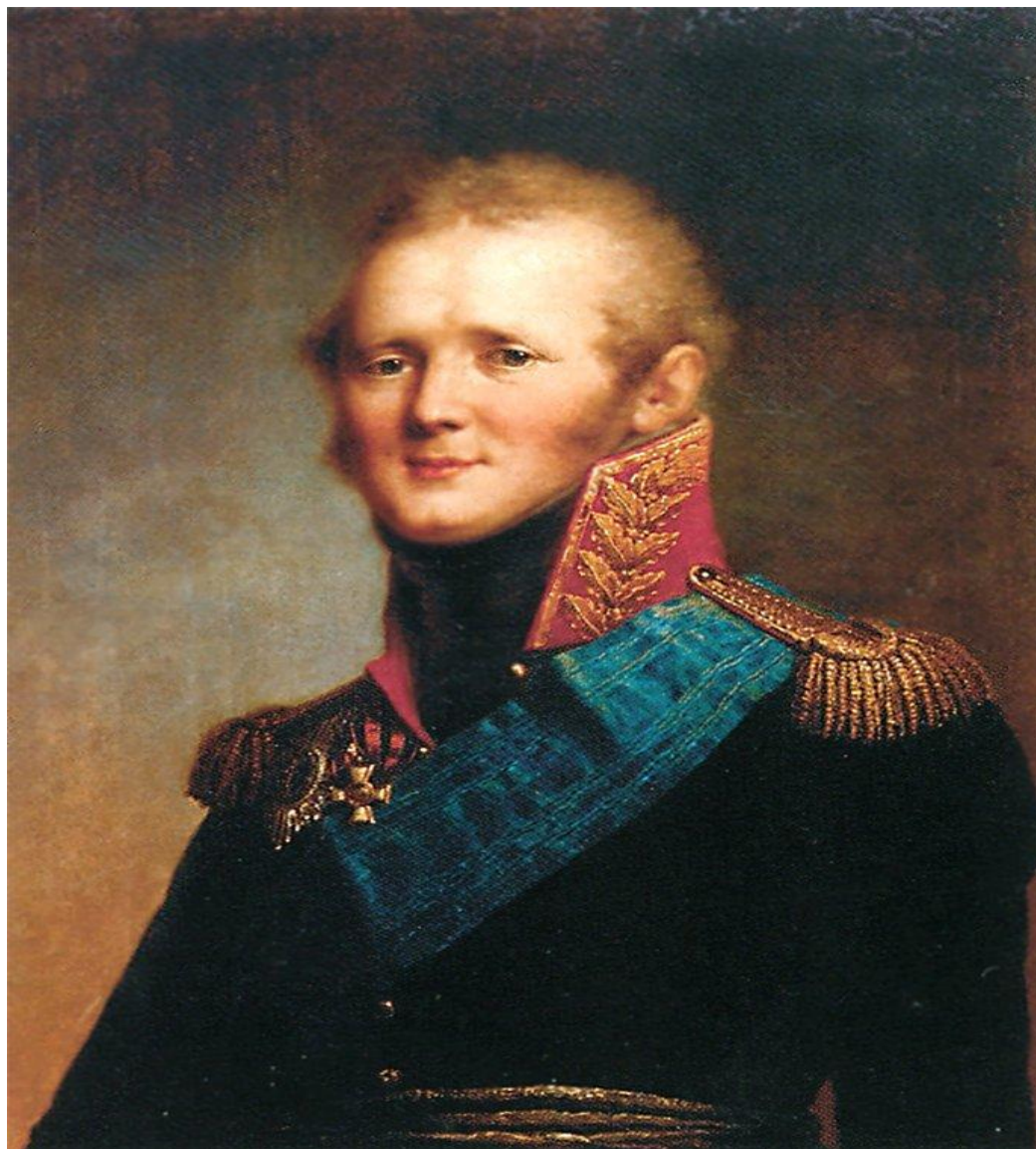
Александр I Павлович