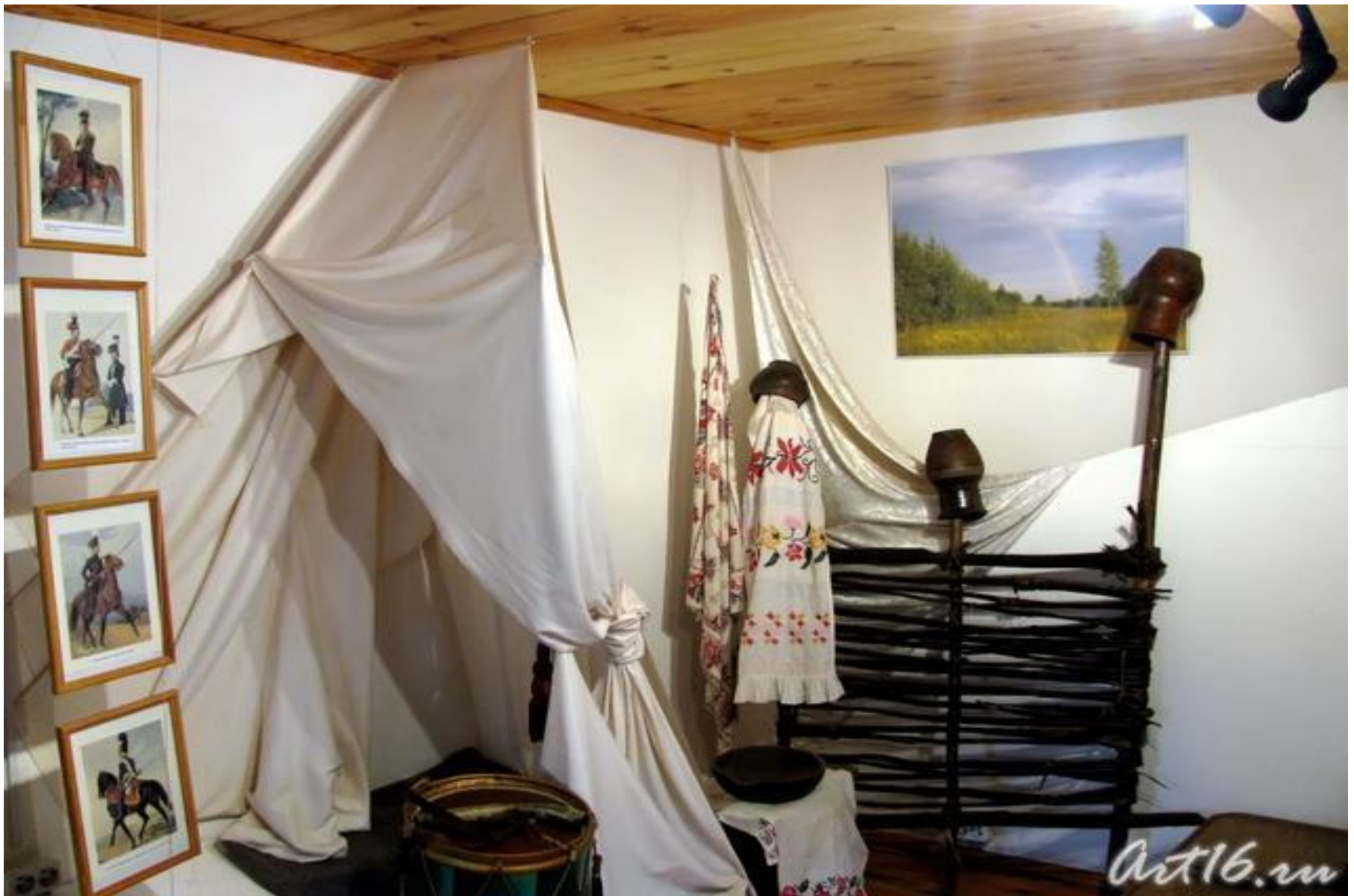
Фрагмент экспозиции, рассказывающий о детстве