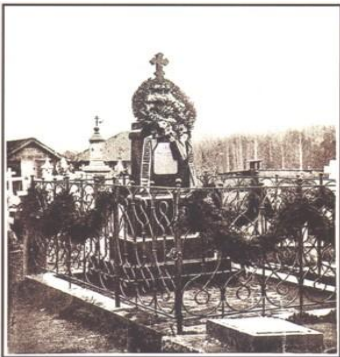
Памятник „кавалеристъ-дѣицѣ“ Надеждѣ Дуровой - Александровой, открытый 11-го октября 1901 г. въ г. Елабугѣ.