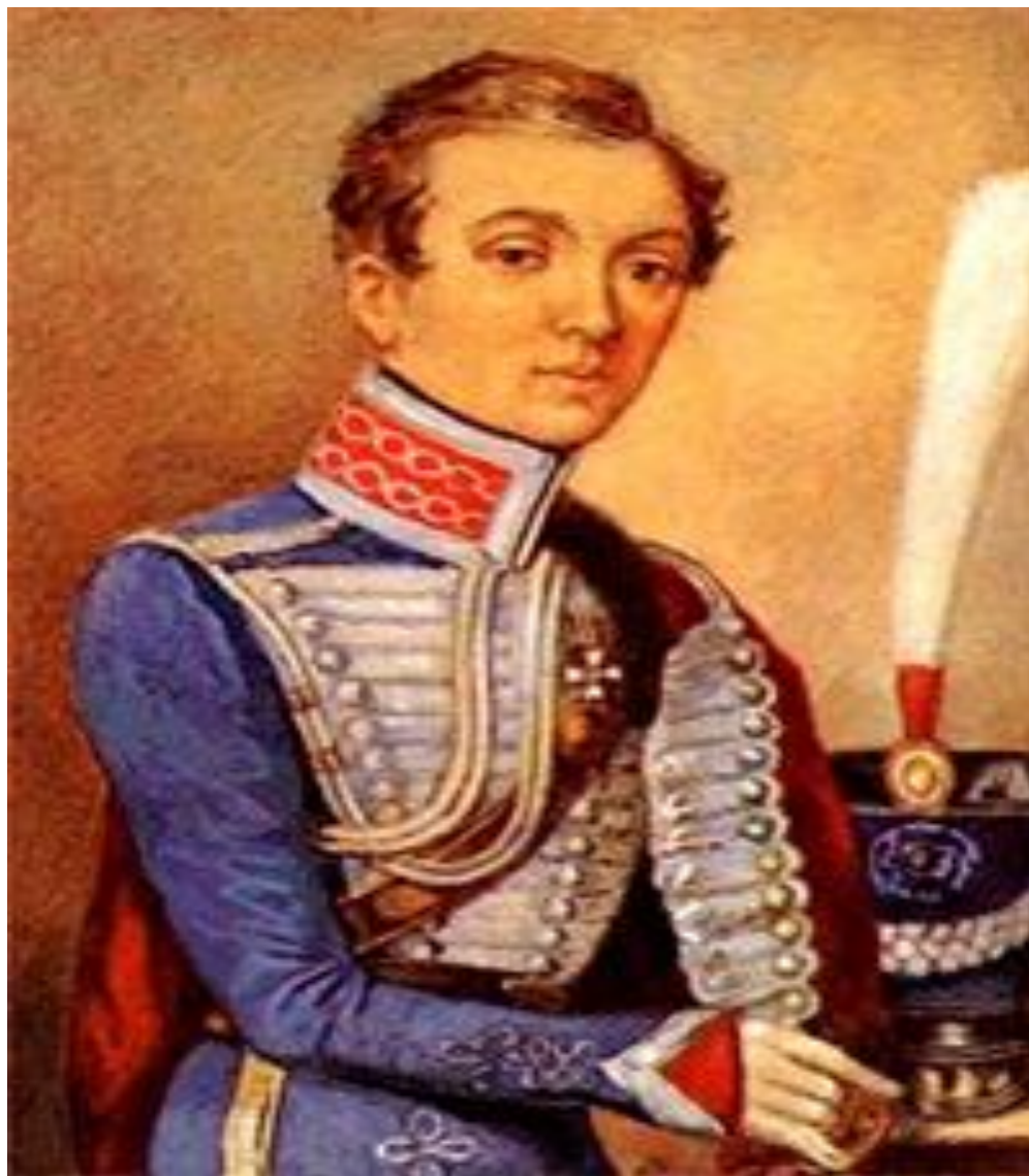
Надежда Андреевна Дурова