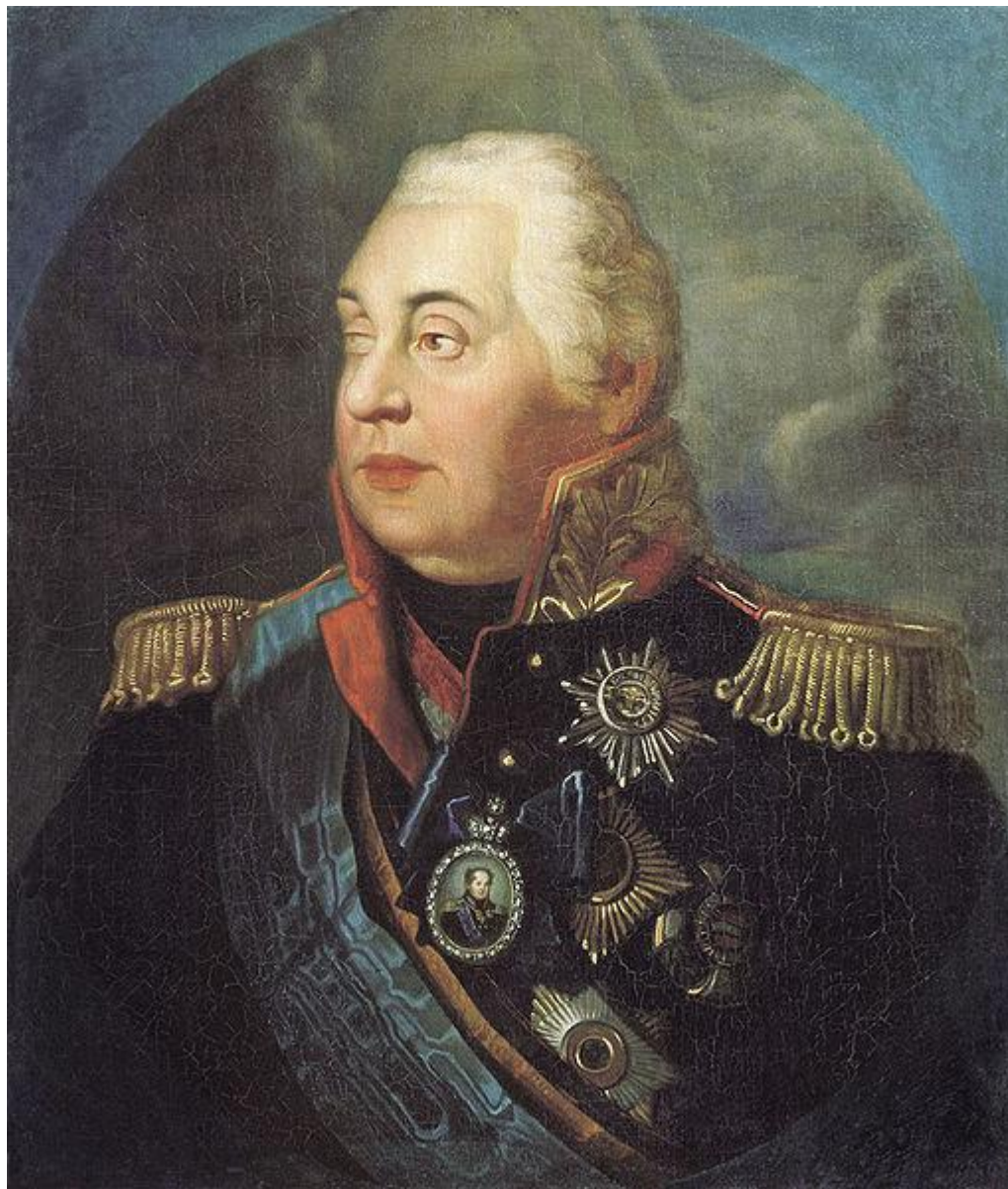
Портрет М. И. Кутузова