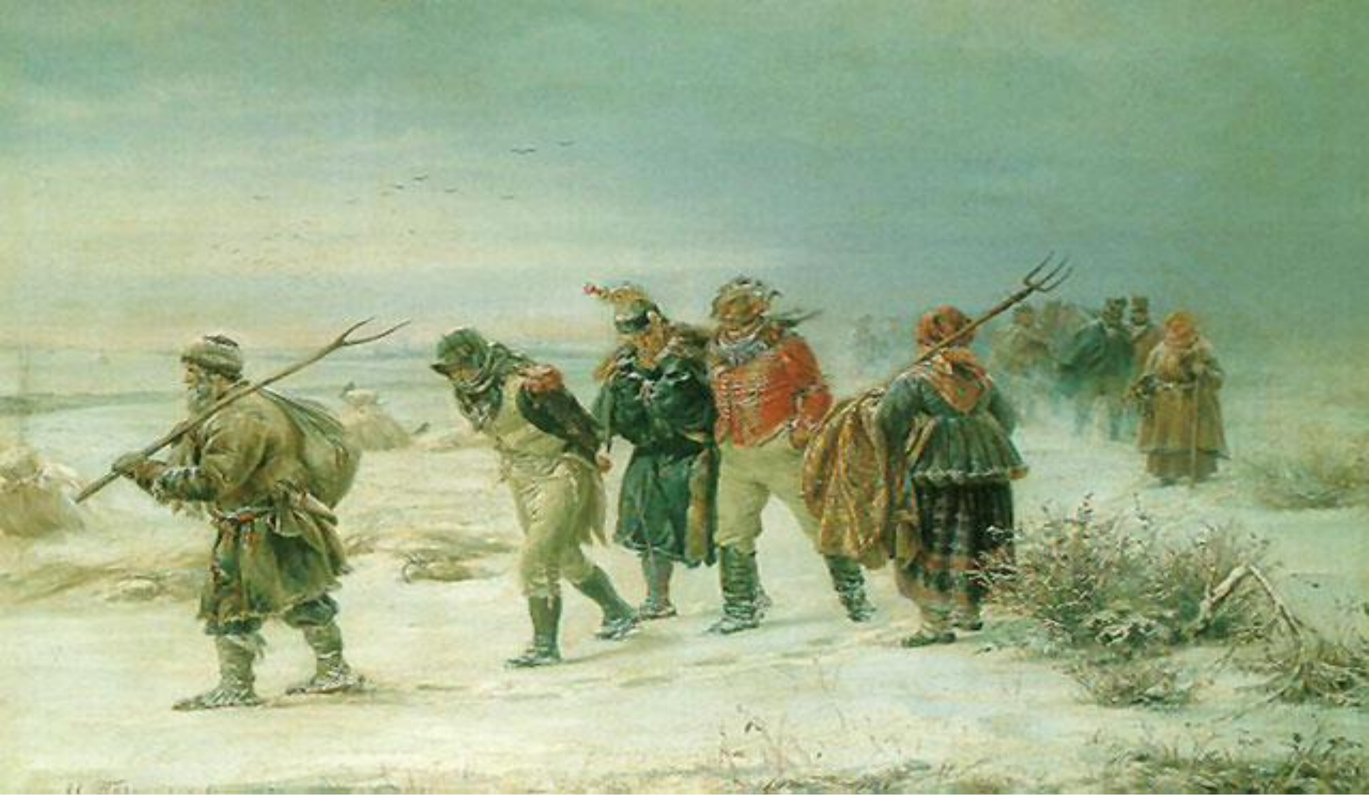
Отечественная война 1812 года. Французы в 1812 г., пленённые ополчением (И. М. Прянишников)