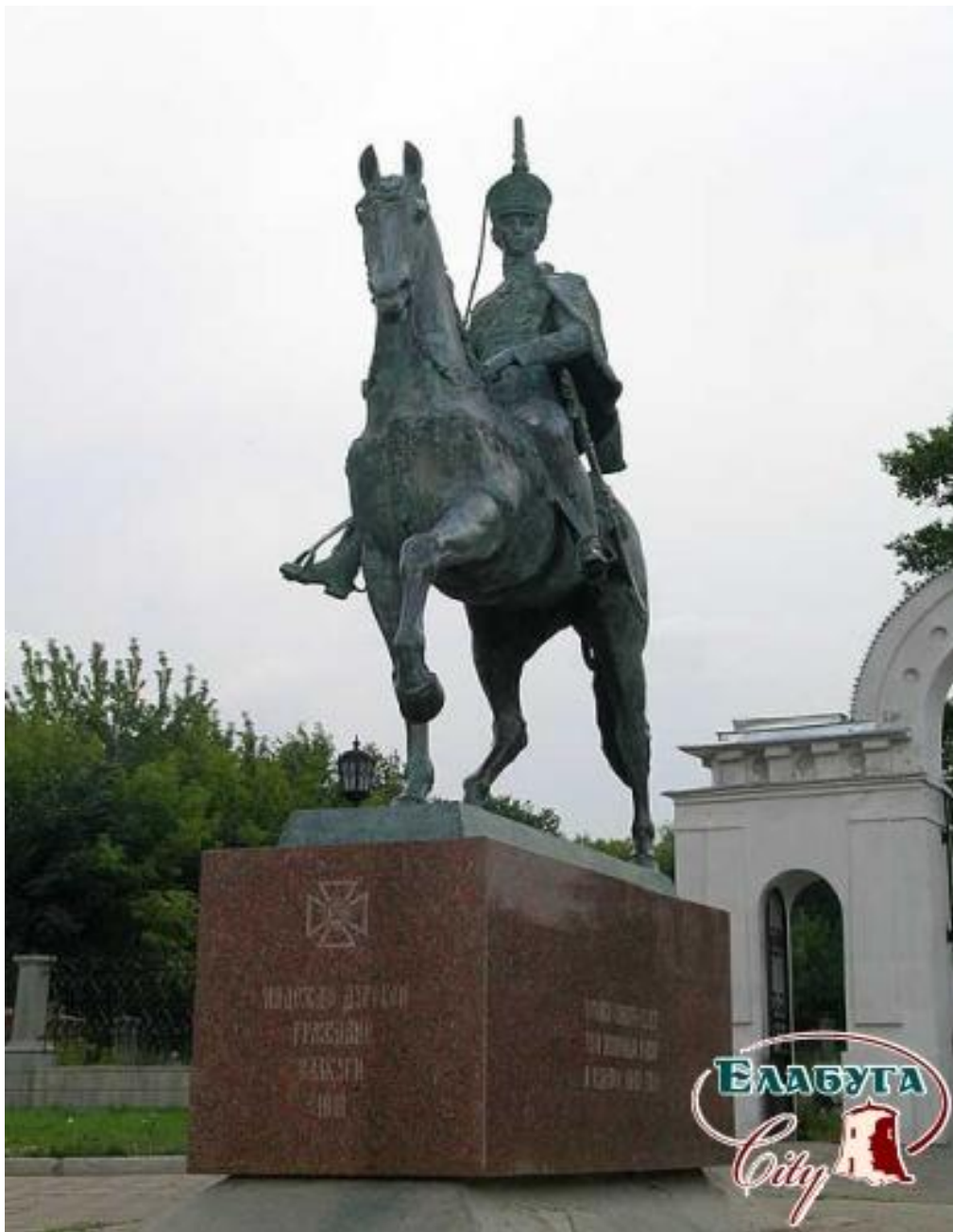
Памятник Надежде Андреевне Дуровой