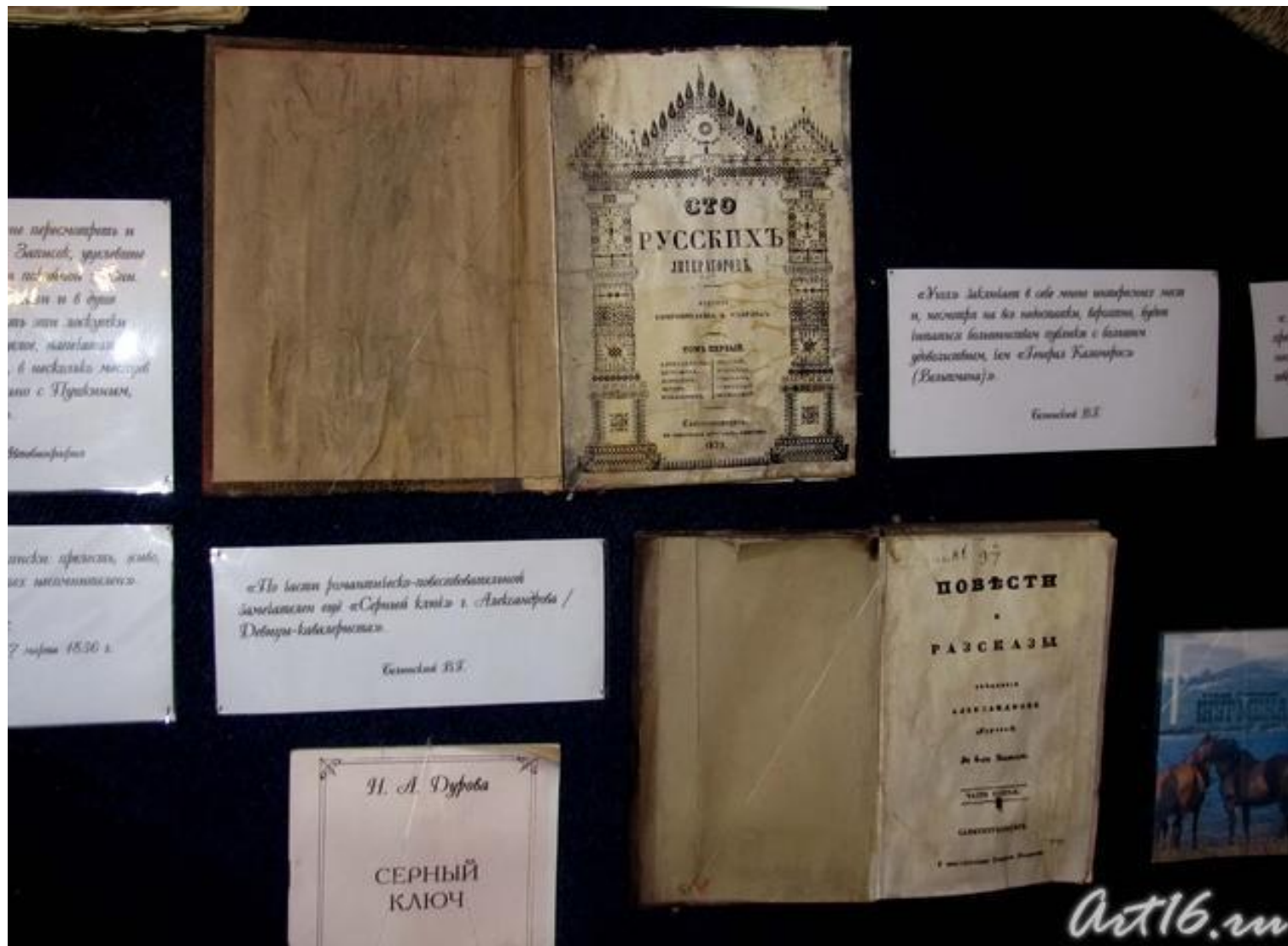
Книги Н.Дуровой, изданные под именем Александрова