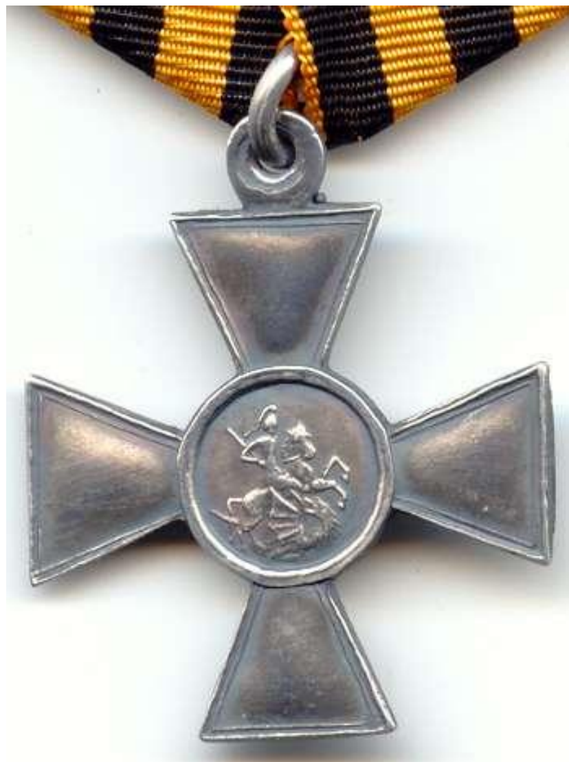
Знак отличия Военного ордена 3-й степени