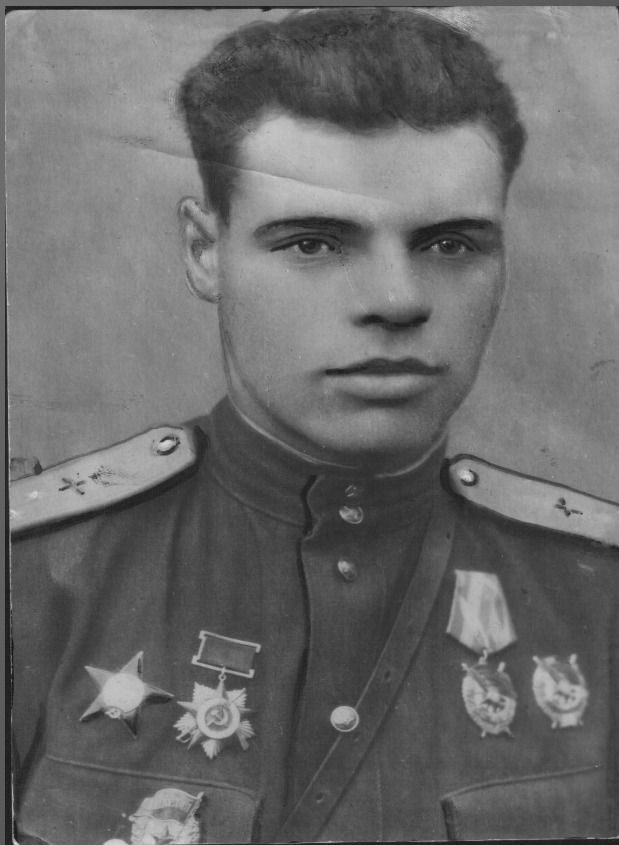
Герой Советского Союза А.О.Молев