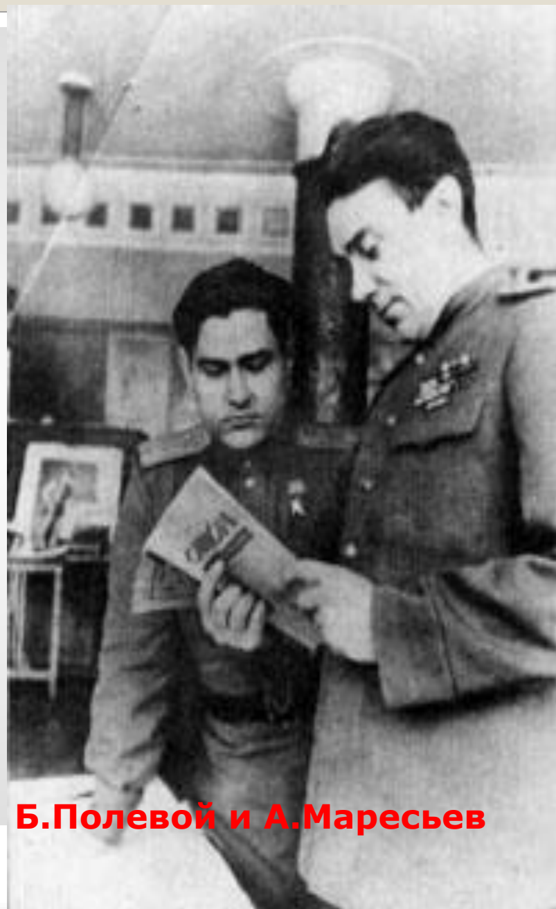
Б.Полевой и А.Маресьев