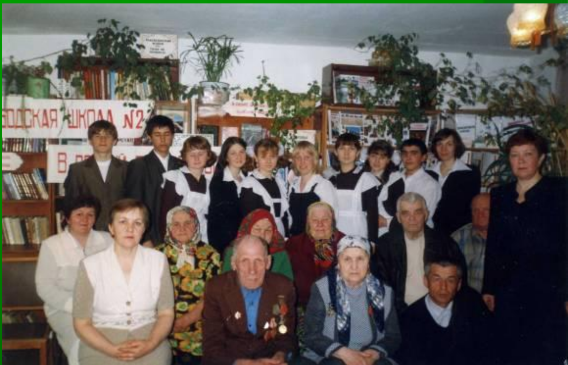
Встреча у вечного огня школы с ветеранами Великой Отечественной войны

Все меньше ветеранов с каждым годом встречаем мы у Вечного огня, которые добыли в 45-ом ПОБЕДУ для тебя и для меня.