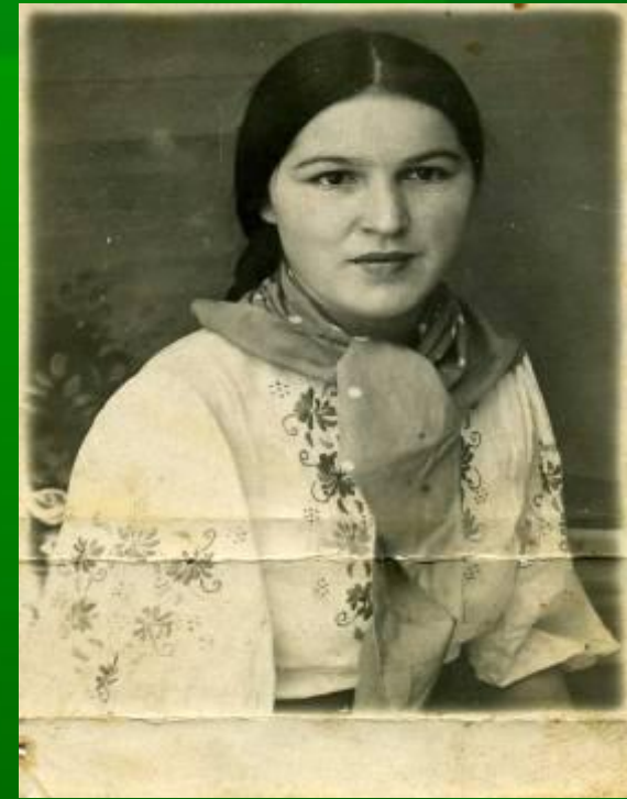
Моя бабушка перед отправкой на фронт.

Нам не ведома война, Но знаем из рассказов ветеранов, Что это испытание страна Достоинно вынесла, но не зажили раны.