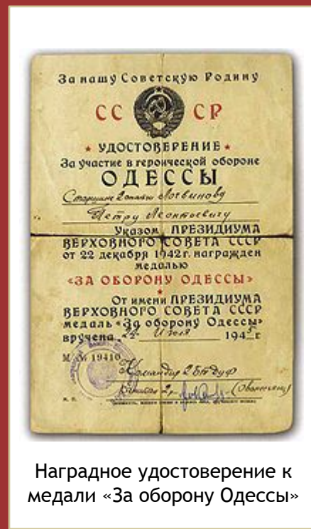
Наградное удостоверение к медали «За оборону Одессы»