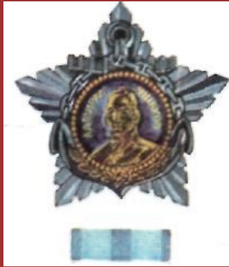
Орден Ушакова 1-й степени