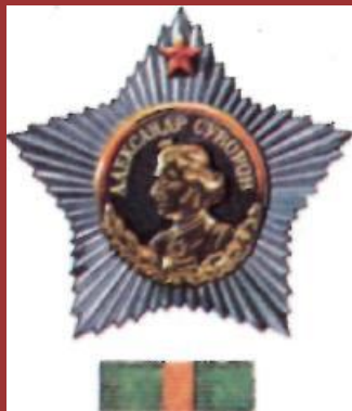
Орден Суворова 1-й, 2-й и 3-й степени