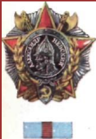
Орден Александра Невского

29 июля 1942 г. были учреждены ордена, названные именами великих русских полководцев, — орден Суворова 1-й, 2-й и 3-й степени, орден Кутузова 1-й и 2-й степени и орден Александра Невского. Ими награждаются командиры Советской Армии, обладающие высокими полководческими качествами и сумевшие добиться победы при проведении боевых операций.