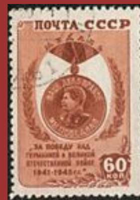
Почтовая марка СССР, 1946

Интересно, что Сталин смотрит вправо (в сторону Японии), а в медали «За Победу над Германией» он смотрит влево (в сторону Германии).