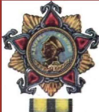
Орден Нахимова 1-й степени