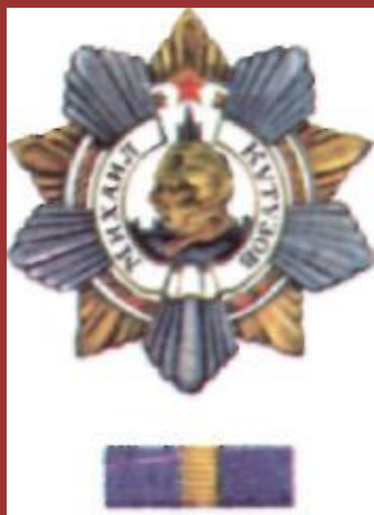
Орден Кутузова 1-й и 2-й степени