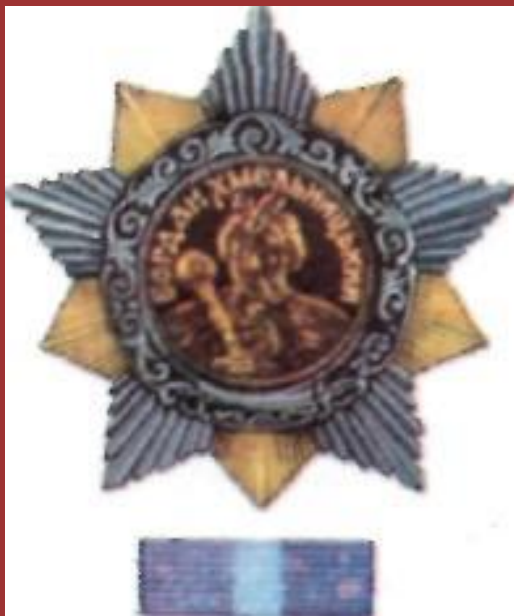
Орден Богдана Хмельницкого 1-й степени.

В боях за Украину 10 октября 1943 г. был учрежден орден, связанный с именем выдающегося исторического деятеля и полководца Украины Богдана Хмельницкого . Этим орденом 1-й, 2-й и 3-й степени награждаются командиры и бойцы Советской Армии и партизанских отрядов, проявившие храбрость и мужество в операциях по разгрому врага.