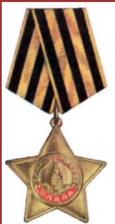
Орден Славы 1-й, 2-й и 3-й степени

В разгар наступательных боев Советской Армии 8 ноября 1943 г. были учреждены еще два ордена — орден «Победа» и орден Славы.