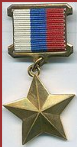
Российская медаль «Золотая Звезда»

Герою Советского Союза вместе с медалью «Золотая Звезда» вручалась высшая награда СССР — орден Ленина.