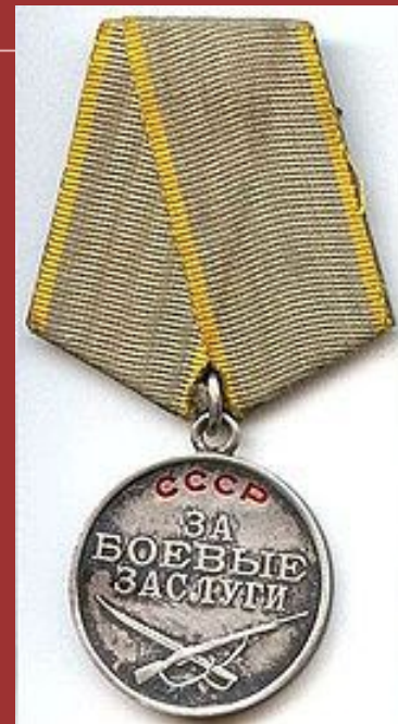
Медаль «За боевые заслуги»

До начала Великой Отечественной войны за мужество и отвагу при защите государственных границ СССР и в советско-финской войне медалью было награждено около 26 000 военнослужащих. Во время Великой Отечественной войны за период с 1941 по 1945 год было произведено более 4 млн. награждений.