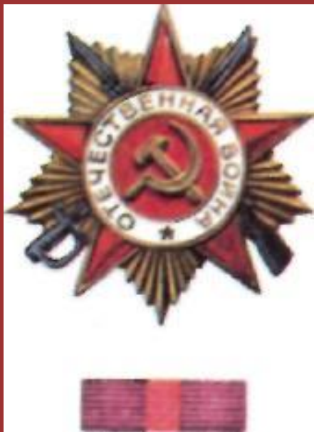
Орден Отечественной войны 1-й степени.