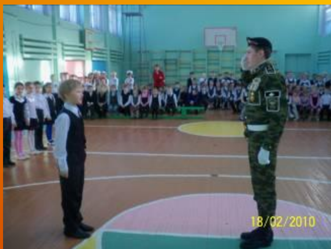
Смотр строя и песни