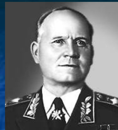
Конев Иван Степанович