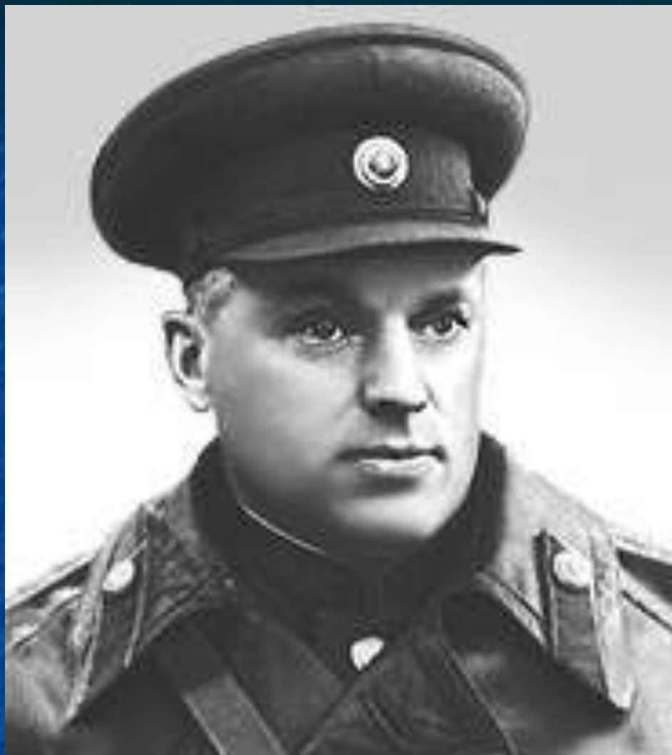
Рокоссовский Константин Константинович