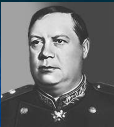
Толбухин Федор Иванович