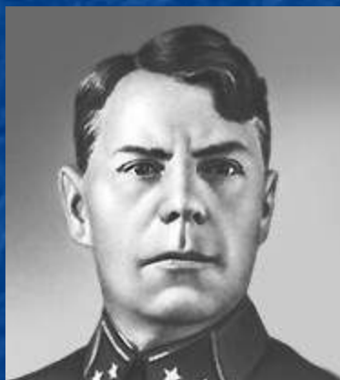
Василевский Александр Михайлович