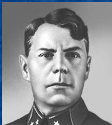
Василевский Александр Михайлович