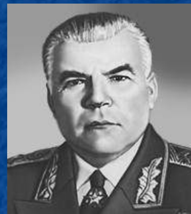
Малиновский Родион Яковлевич