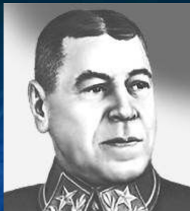
Шапошников Борис Михайлович