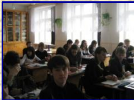
Кабинеты химии, физики, биологии, географии - просторные помещения. Их лаборатории оборудованы для хранения, систематизации и обновления учебных материалов.