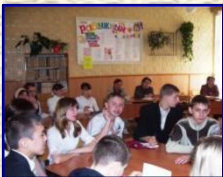
Кабинеты русского языка и математики имеют шкафы для хранения дидактического, методического и наглядного материалов