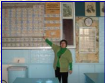
Кабинет химии оборудован вытяжной системой, демонстрационной кафедрой.