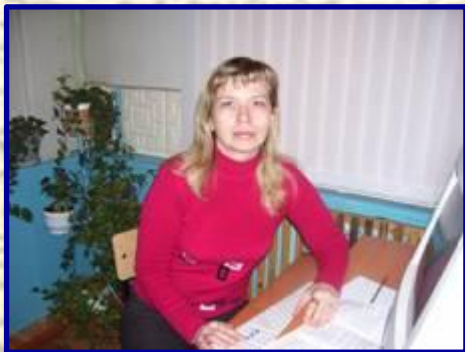
Заместитель директора по методической работе