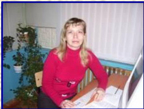
Заместитель директора по методической работе