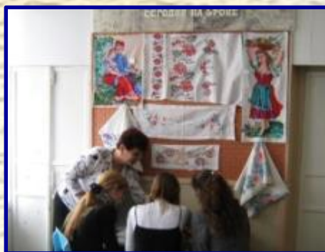
Мастерские предназначены для организации практического обучения учащихся. Оснащены специальным оборудованием, инструментами, приспособлениями, технической и технологической документацией.