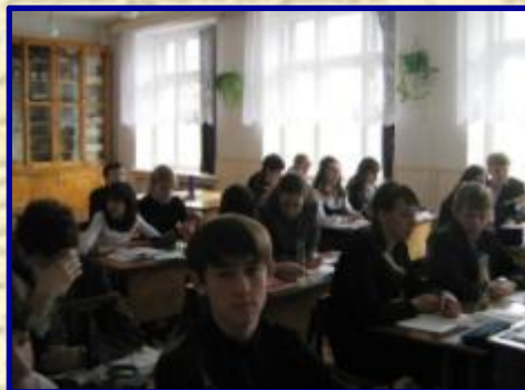
Кабинеты химии, физики, биологии, географии - просторные помещения. Их лаборатории оборудованы для хранения, систематизации и обновления учебных материалов.