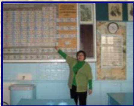
Кабинет химии оборудован вытяжной системой, демонстрационной кафедрой.