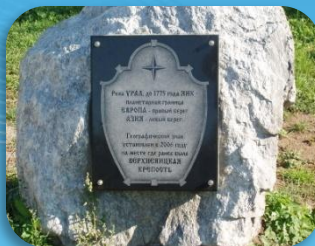
7. Знак Европа - Азия