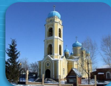
10. Свято - Никольская церковь