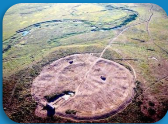
1. Арк Нойа