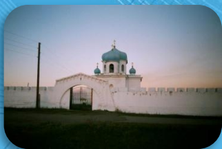
3. Укрепление наследника