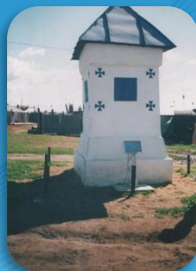
6. Памятник казакам русско - японской войны