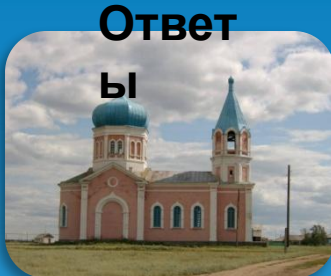
5. Церковь апостолов Петра и Павла