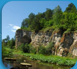
2. Игнатиевская пещера