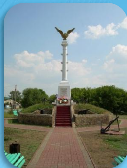
4. Памятная колонна