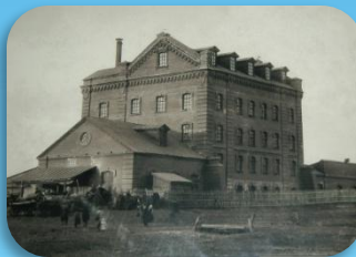
8. Паровая мельница купца В.Е. Гогина