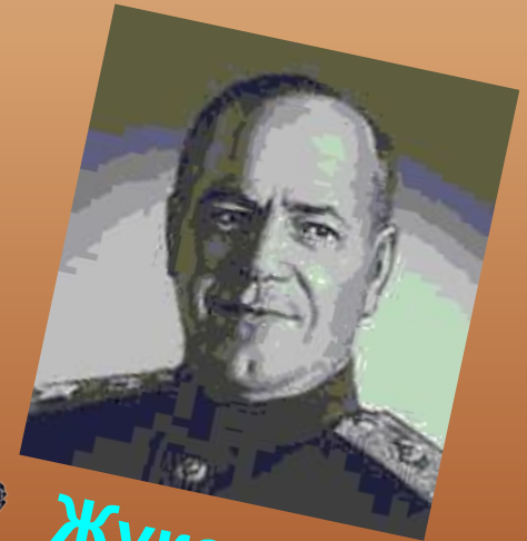
Жуко́в Г. К.