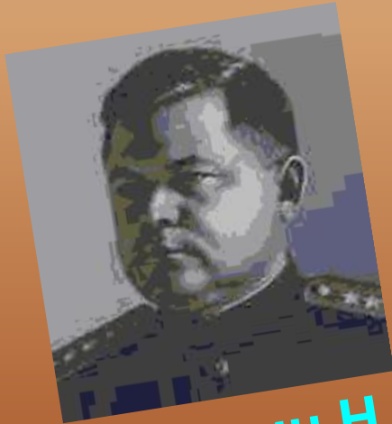
Вату́тин Н. Ф.