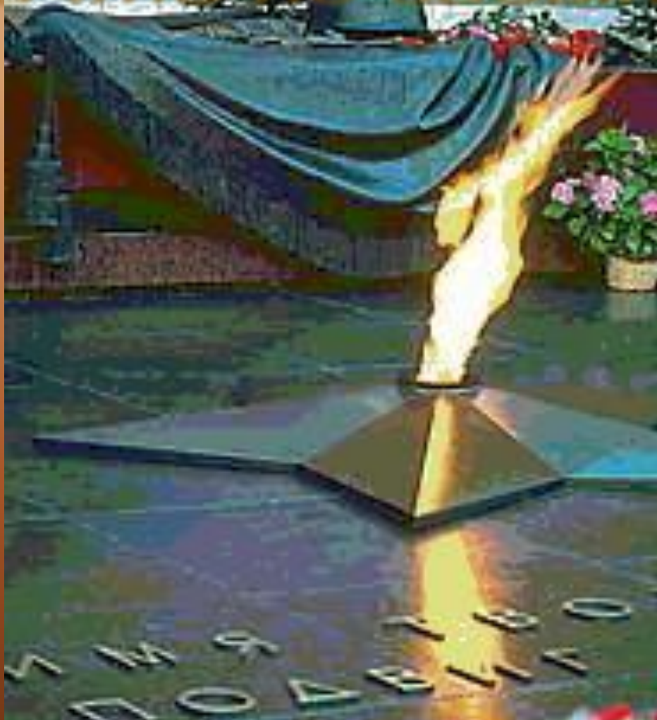
Могила Неизвестного солдата