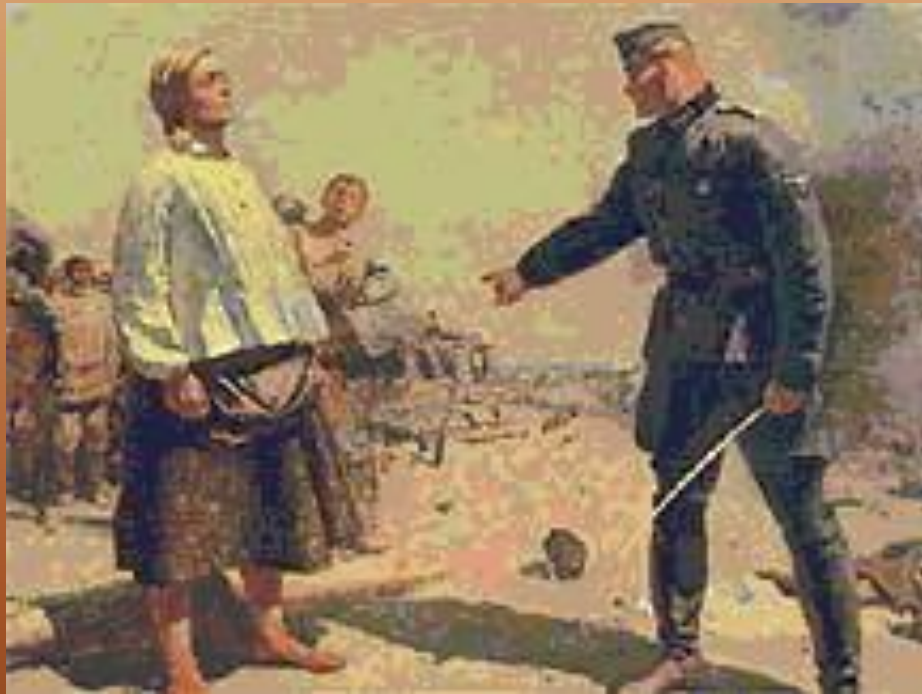
Издвательство над людьми