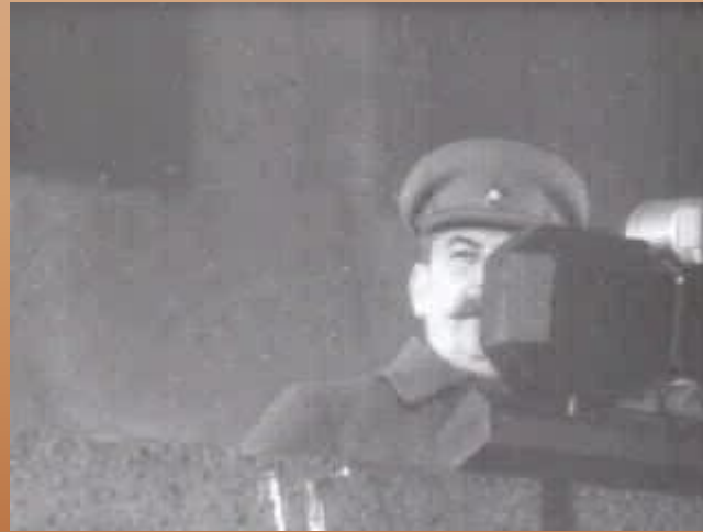
Ста́лин И. В.