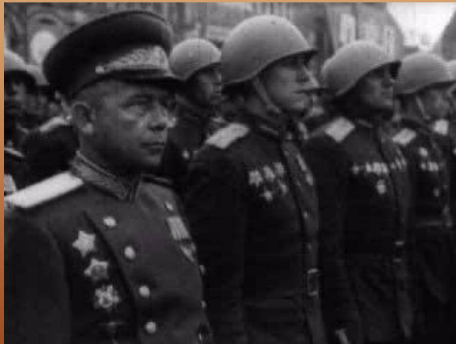
Парад Победы г.Москва