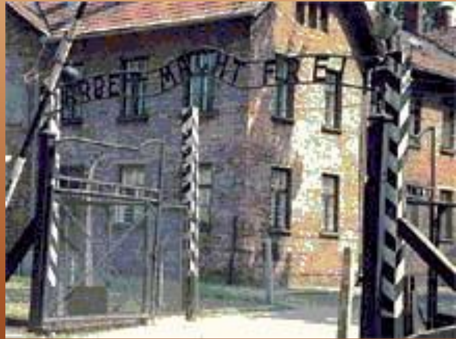
Мучили в застенках лагерей: Освенцим, Дахау