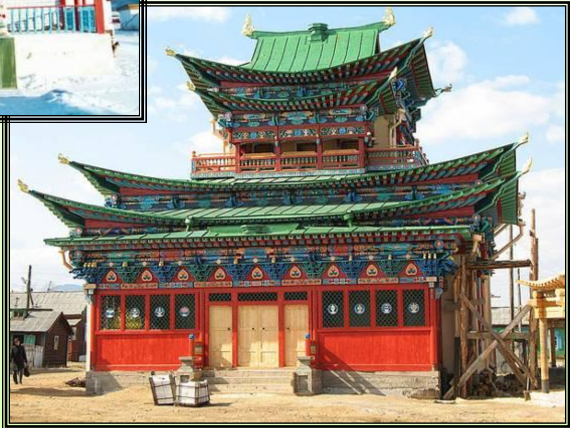
Иволгинский дацан – буддийский монастырь-университет