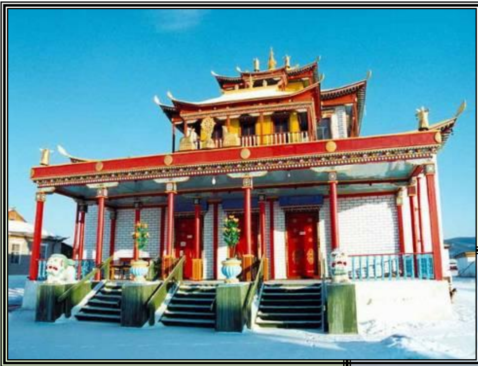
Буддийский храм в Бурятии