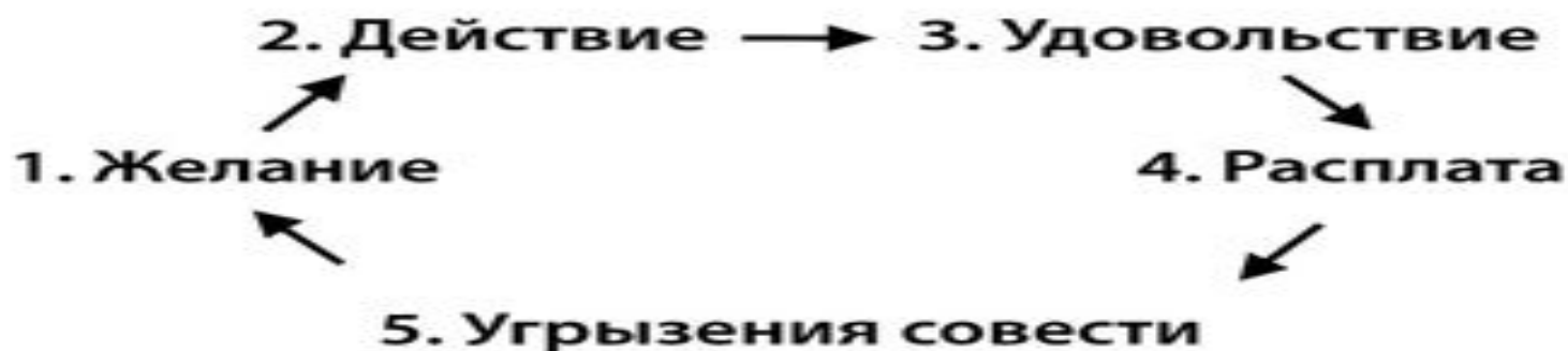
Рис. 1: Схема работы вредных привычек