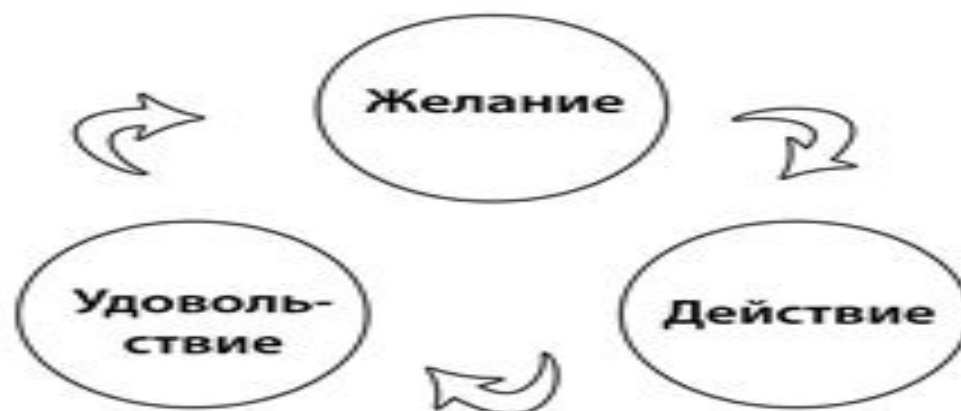
Рис. 2: «Двигатель» вредных привычек