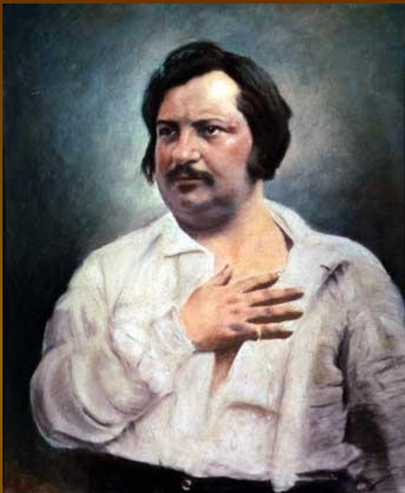
Оноре де Бальзак (1799-1850гг.)