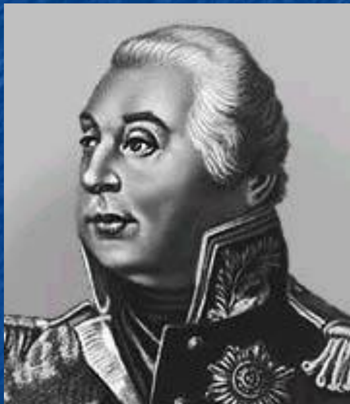
М. И. Кутузов