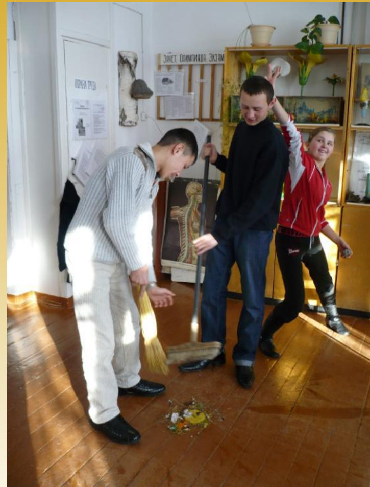
Субботники и генеральные уборки