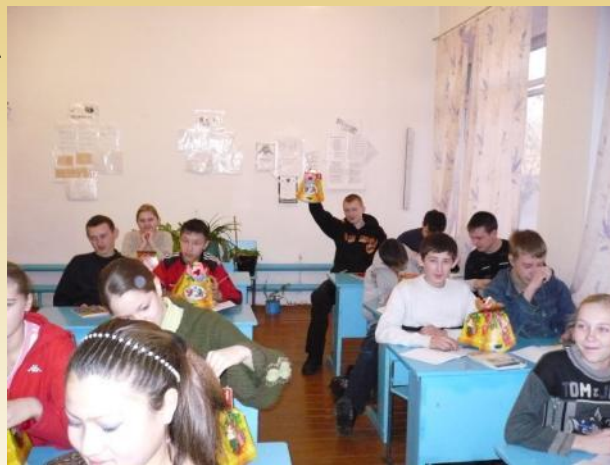
Сюрприз от родителей