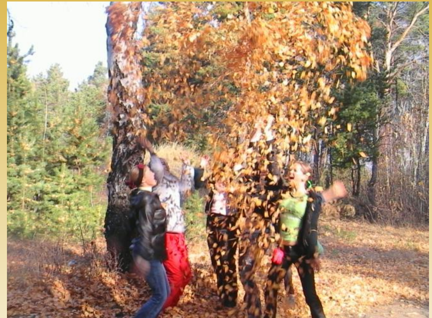
Походы на природу

-это способ организации яркой, наполненной трудом, творчеством и общением жизни единого коллектива классного руководителя и воспитанников. Дело это — творческое, коллективное, потому что представляет собой совместный поиск лучших решений жизненно важной задачи; потому что оно творится сообща — не только выполняется, но и организуется, задумывается, планируется, оценивается также совместно.