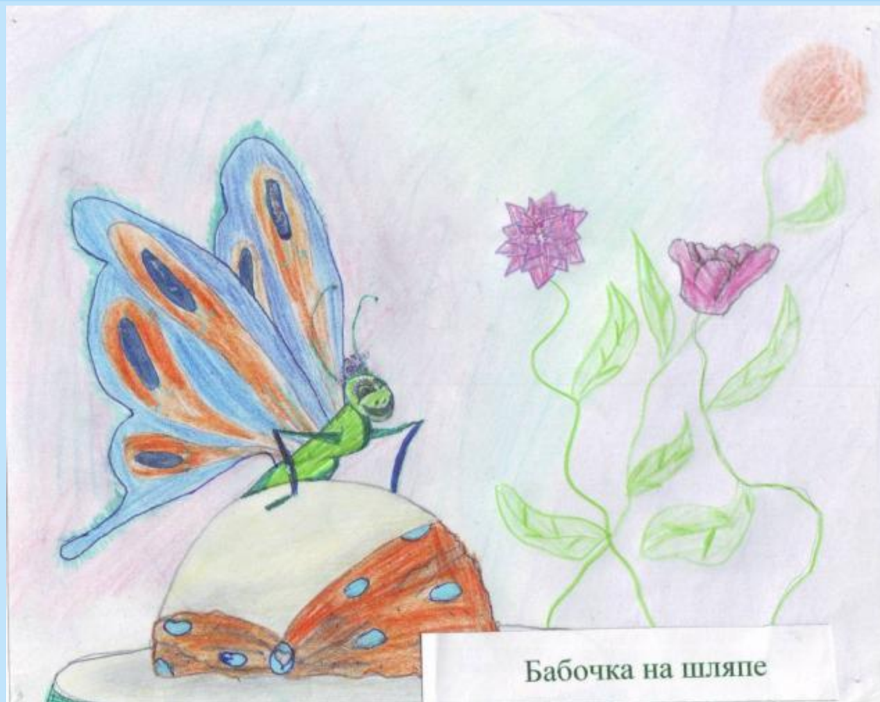
Бабочка на шляпе