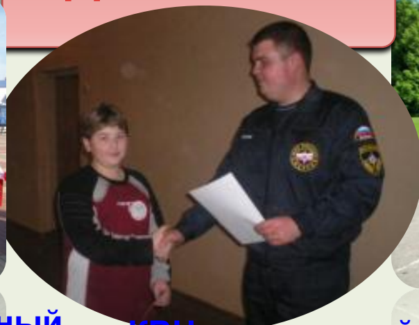
КВН по пожарной безопасности