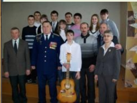
Встреча с воинами- афганцами