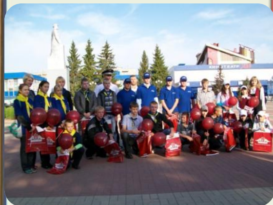
Акция «Внимательный водитель, безопасный пешеход»