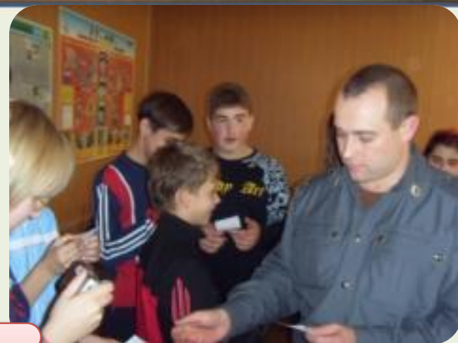
КВН по ПДД