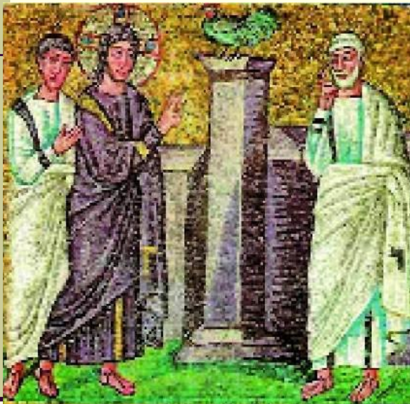
Христос предсказывает Петру предательство. Мозаика.