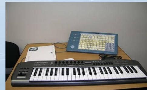
Индивидуальный подход к обучению с использованием специализированного оборудования