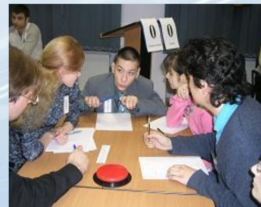
Межрегиональные тематические соревнования