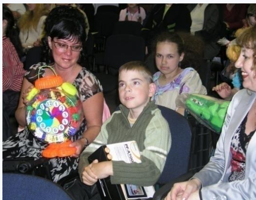
Конкурс «Моя семья»