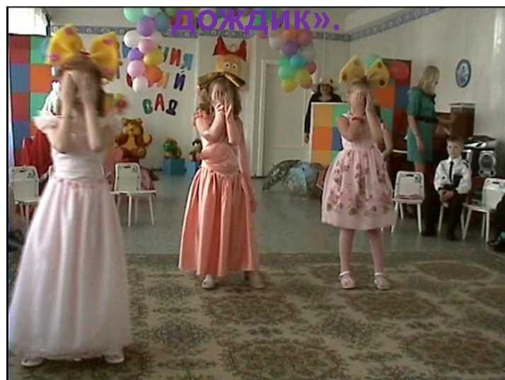
Попурри Группа «Иванушка», песня «Кукла»