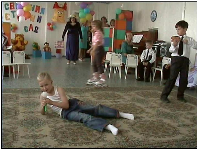
Дима Билан «Believe me»