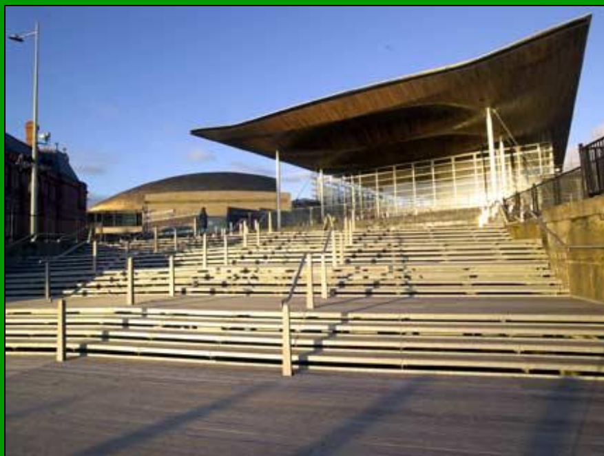
Здание Национальной Ассамблеи в Кардиффе - Senedd