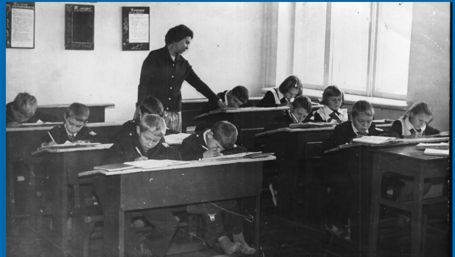
Молодой педагог на уроке