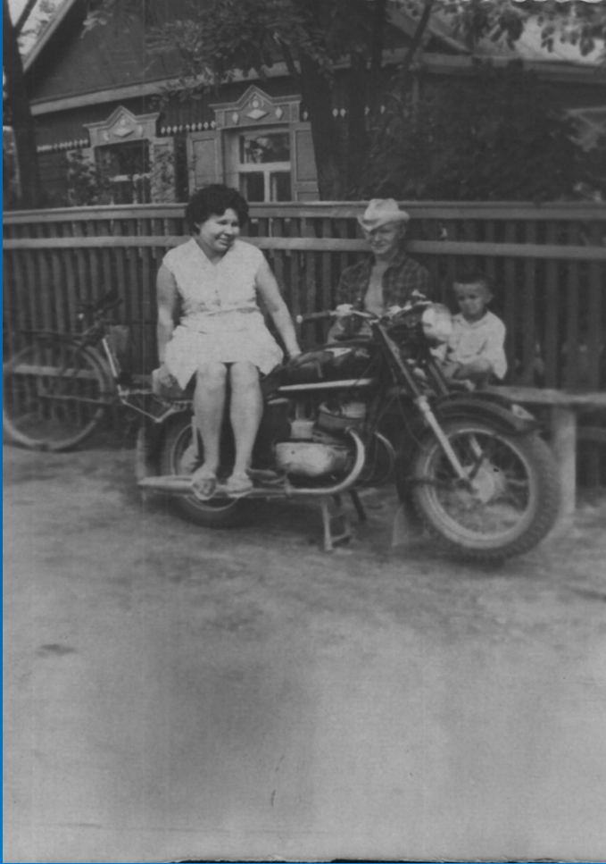
Студентка на каникулах