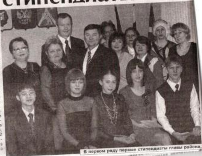
В первом ряду первые стипендиаты главы района.