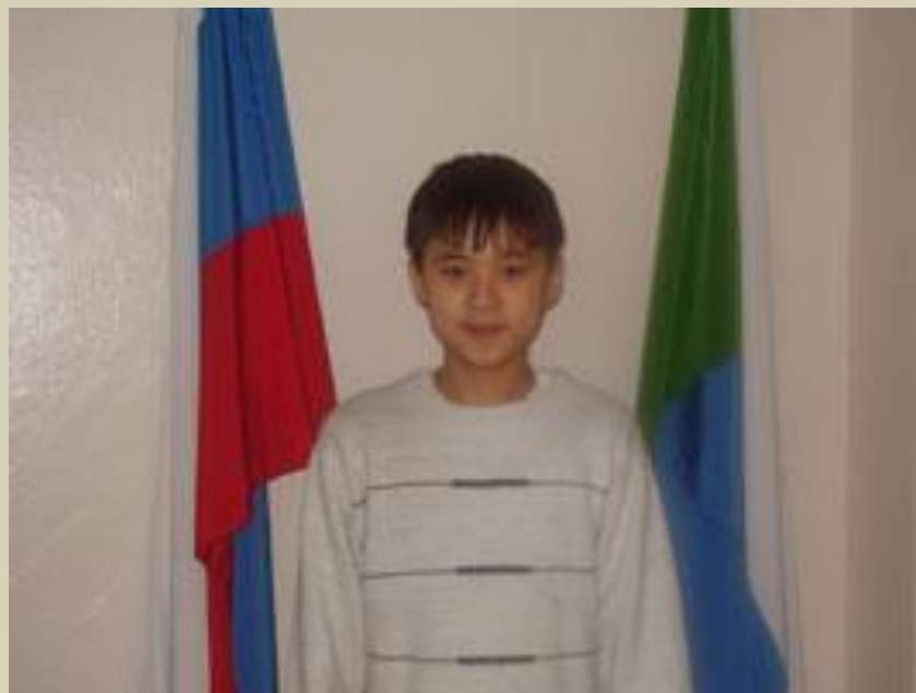
Избран президентом школы с. Тополево