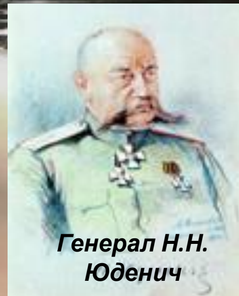
Генерал Н.Н. Юденич