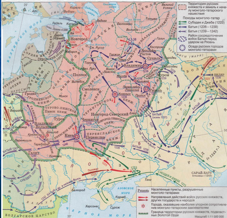
МОНГОЛО-ТАТАРСКОЕ НАШЕСТВИЕ НА РУСЬ. 1223—1242 гг.