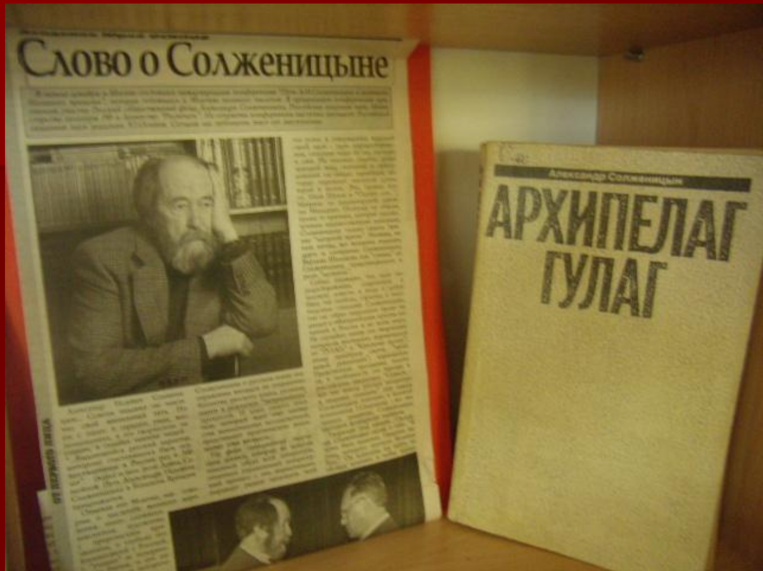
Вселенная имеет столько центров, сколько в ней живых существ. Александр Солженицын. Архипелаг Гулаг