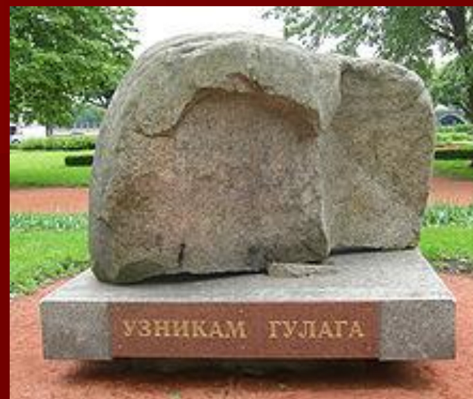
Соловецкий камень в Санкт-Петербурге

Памятник жертвам политических репрессий в СССР камень с территории Соловецкого лагеря особого назначения, установленный на Лубянской площади г. Москва