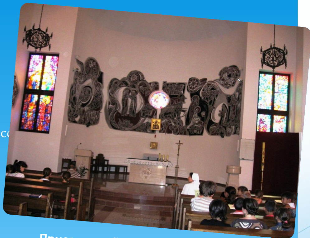
Приезд детей из Атырау в Уральск