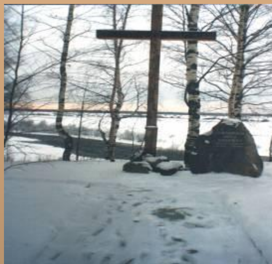
Памятный знак солдатам армии Крайовой