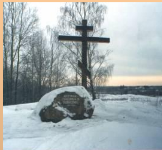
Памятный знак Жертвам политических репрессий