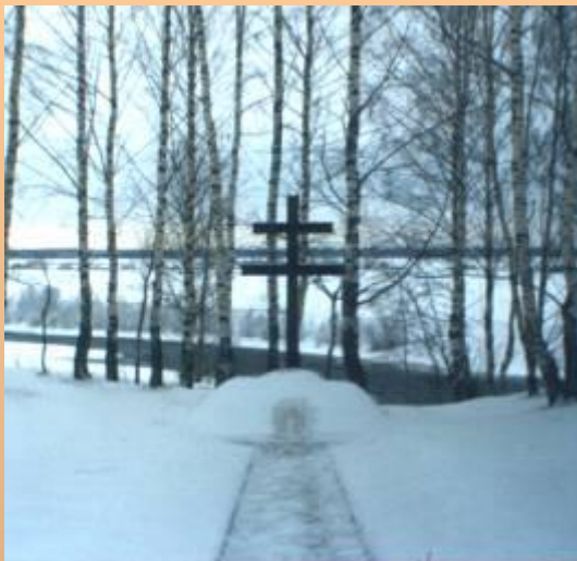
Памятный знак венгерским воинам