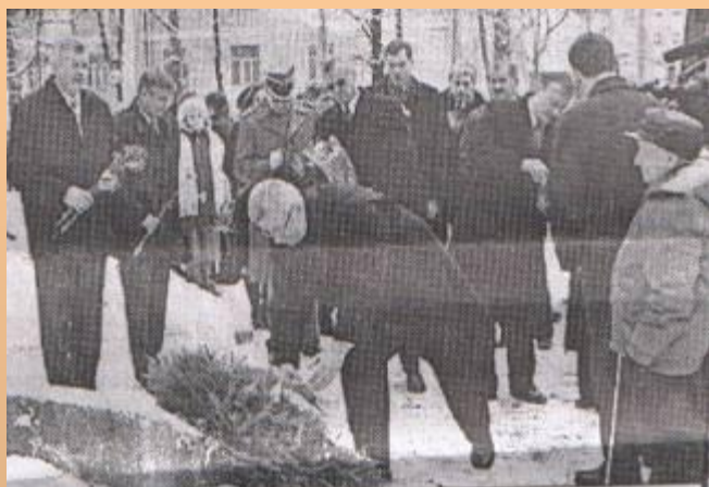
Возложение венков к памявному знаку жертвам политических репрессий на улице Ленинградской.