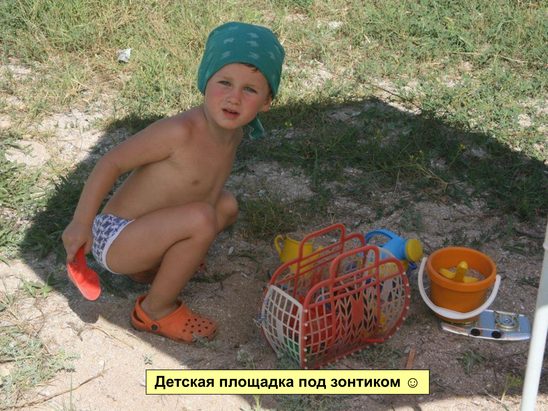
Детская площадка под зонтиком ☺