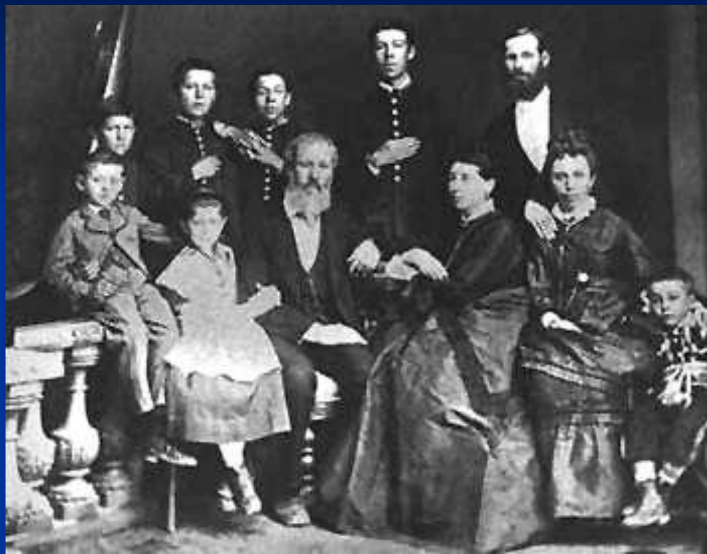
Таганрог, 1874 г.