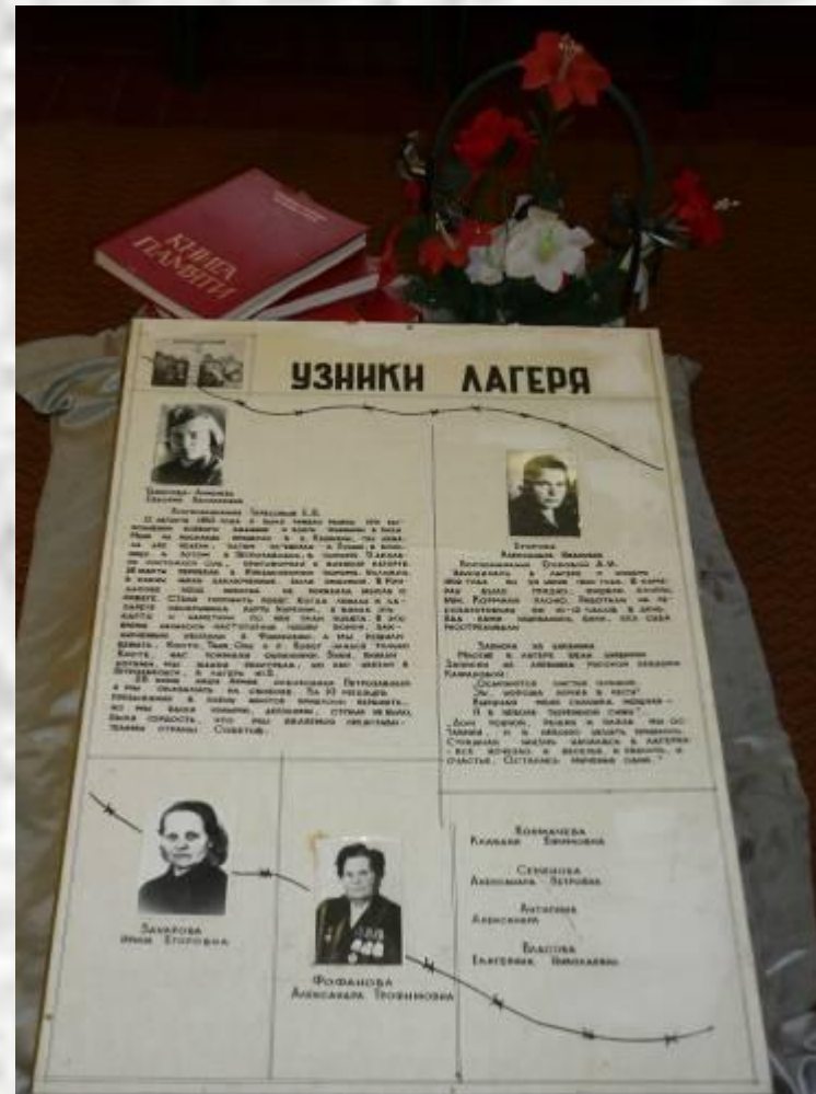
В музее Боевой славы находится стенд, на котором записаны воспоминания узниц концлагеря.