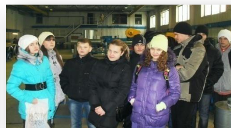
8 В в ЗАО ПМУ «Промвентиляция»,