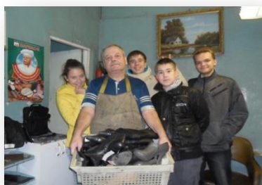
7А класс в ОАО «Элегант»