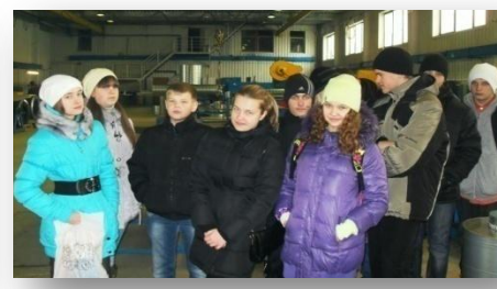
8 В в ЗАО ПМУ «Промвентиляция»,