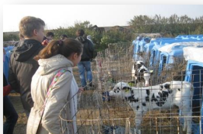
Посещение 8 Б классом ООО «Учхоз»