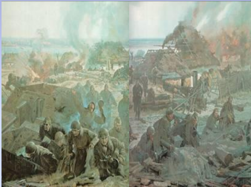
В период оккупации