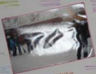
Еще мы ездили в Карайбу

Этот отряд был создан в 2006 году, и с тех пор мы активно участвуем в различных мероприятиях, направленных на улучшение жизни в нашем районе. Мы проводим акции, помогаем пожилым людям, участвуем в спортивных мероприятиях и многому другому. Мы гордимся тем, что сможем принести пользу своему обществу.