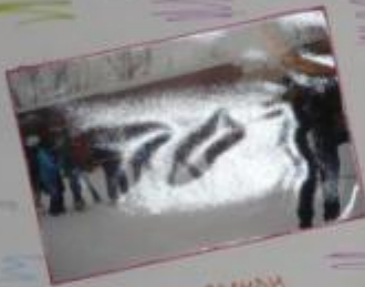
Еще мы ездили в Карабуки

Этот отряд нас собрал и объединил ребят в свои ряды в лагерь волонтеров в лагере «Исток». Мы не знали, что нас ждет там, но мы знали, что нас ждет там, где мы сможем стать лучше, добрее, сильнее и красивее. Мы знаем, что там мы сможем стать настоящими волонтерами!