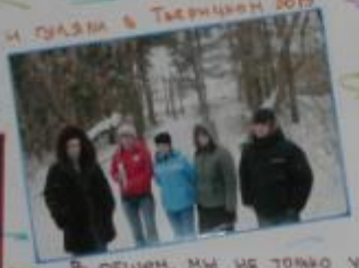
и гуляли в Тьярничен Боту

В общем, мы не только узнаем много нового и интересного, но и пообщались с прекрасными ребятами из других городов и сел!