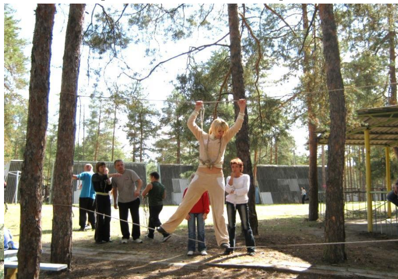
Соревнования по туризму