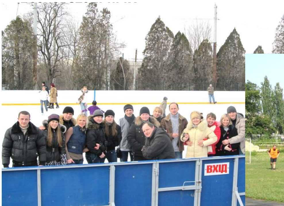
Коллективные походы на каток

Пропаганда здорового образа жизни и активного досуга здесь подкрепляется делами – это организация состязаний, футбольных турниров, творческих вечеров, турслётов. Мы стремимся, чтобы отдых нашей молодежи был активным, здоровым, интересным и