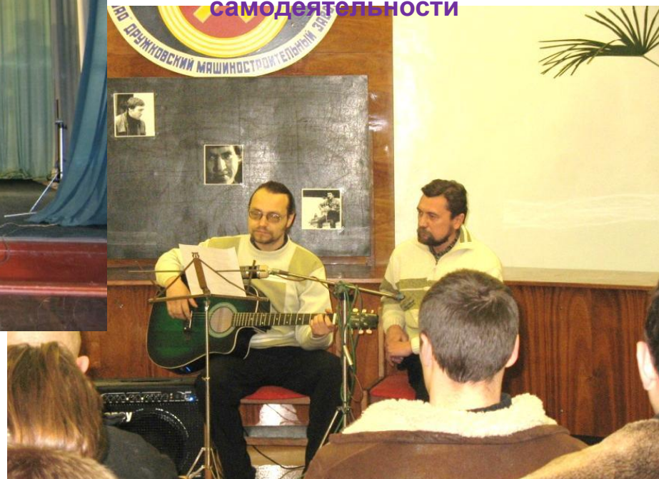
Вечер художественной самодельности