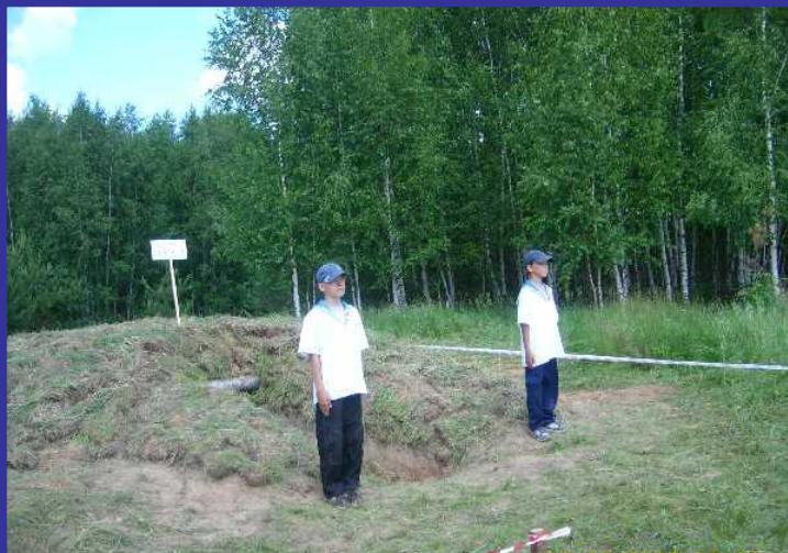
Торжественное открытие землянки