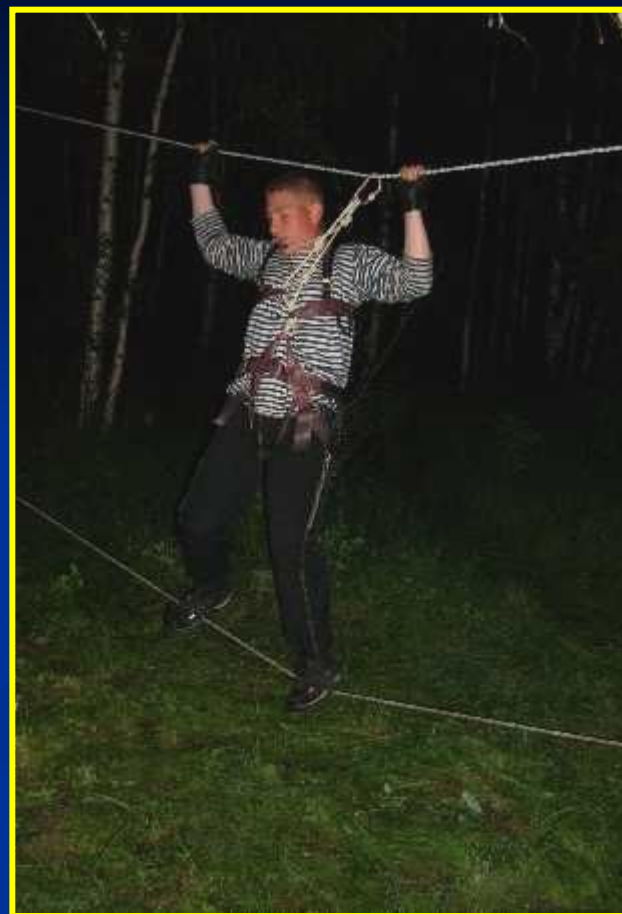
Преодоление полосы препятствий