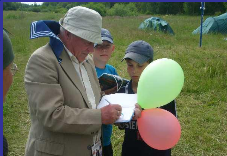
Встреча с Соловецкими юнгами, живущими в г. Ярославле