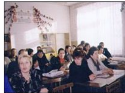
Педагогический коллектив МОУ СОШ №41 г. Тольятти

НОУ школа «Творчество», занявшая I место , награждается специальным Дипломом 1 степени «КМ-Школа» и получает ценный подарок – домашний кинотеатр и приглашение на ежегодный Всероссийский Образовательный Форум в выставочном центре «Сокольники», где будет представлять свой опыт внедрения информационных технологий и использования ИИП «КМ-Школа».