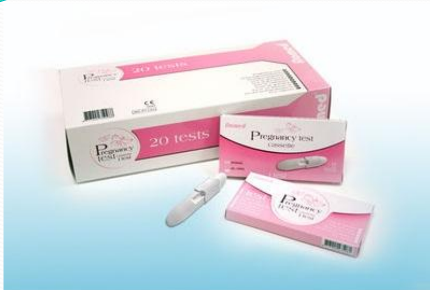
а) Кассетные Полосковые