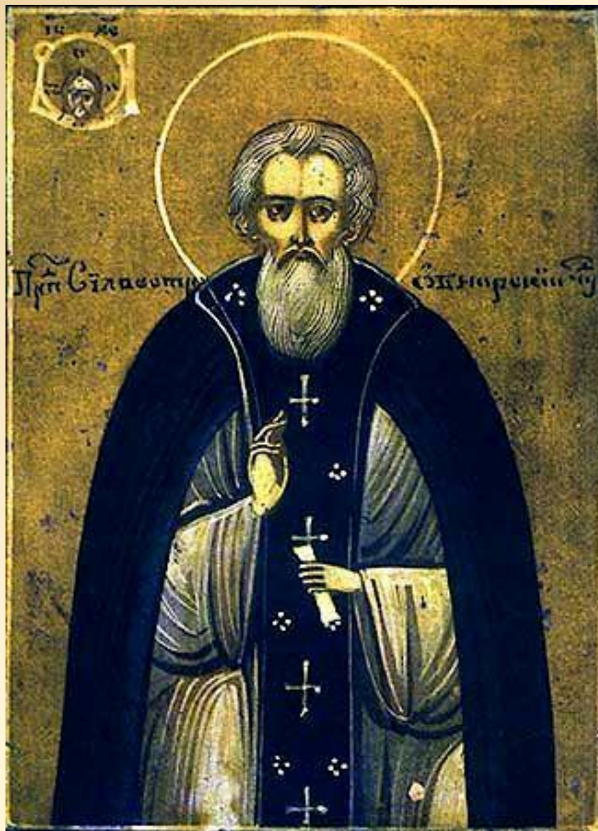
Благовещенский поп Сильвестр — священник московского Благовещенского собора, политический и литературный деятель XVI в.