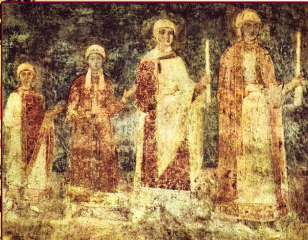
Семья Ярослава Мудрого, фреска Софийского собора в Киеве, 1040-е — начало 1050-х гг.