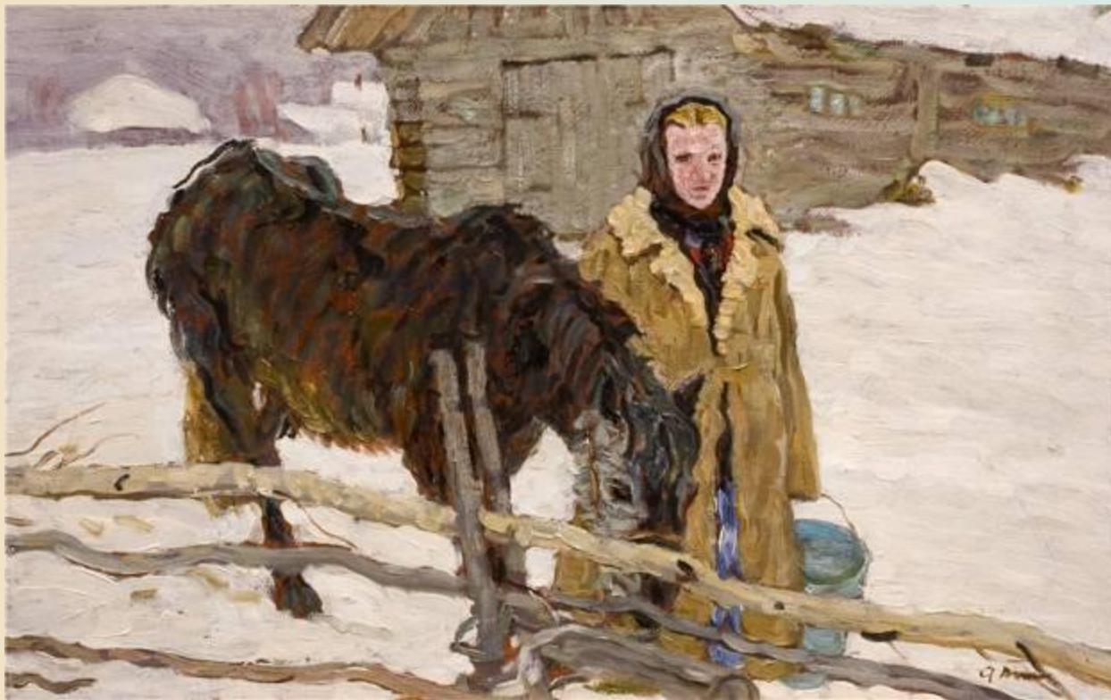
Девушка с лошадью. Ткачев А.П. 1956