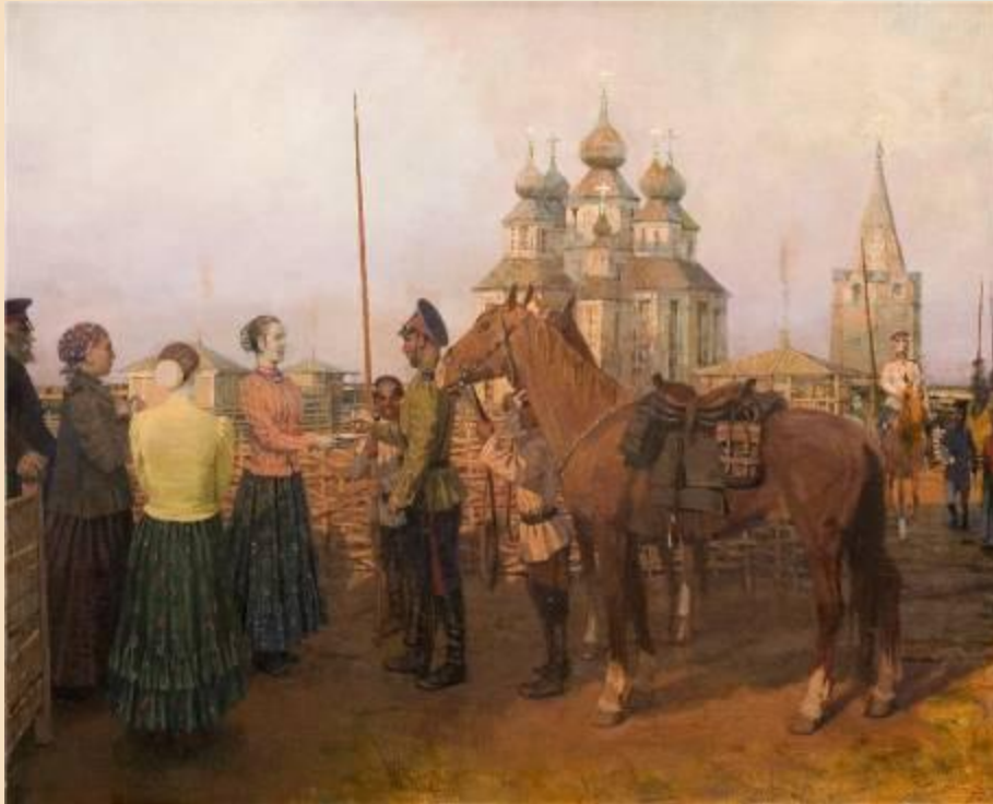
Казачьи проводы. Гавриляченко С.А. 1997