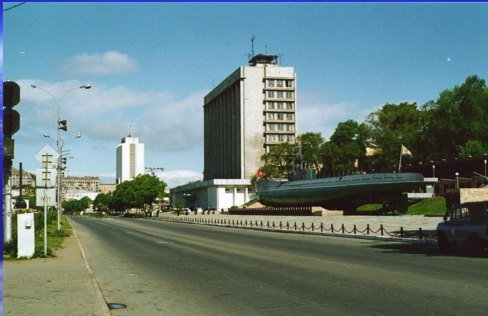
Легендарная лодка С-56.