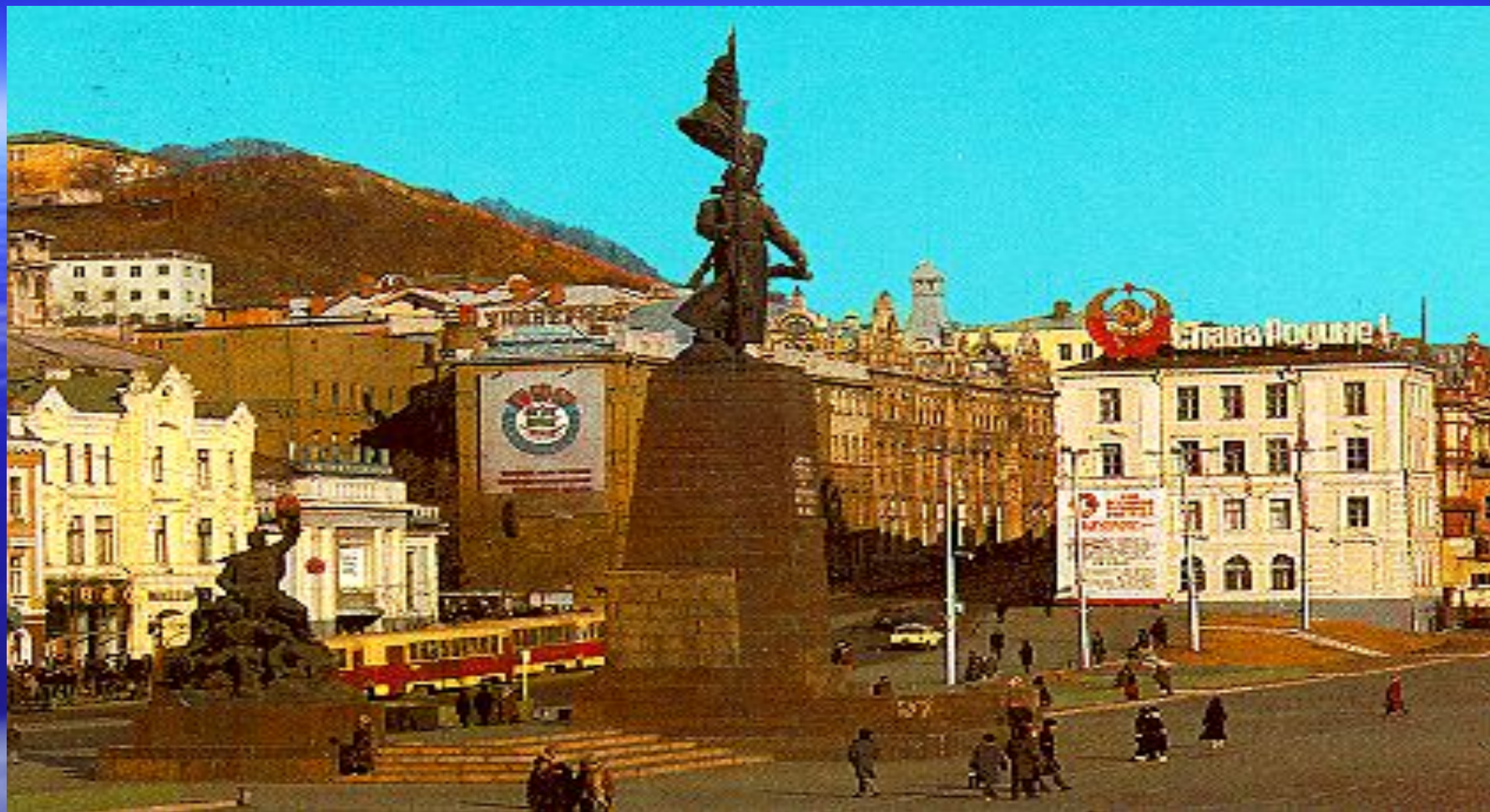
Улица Светланская. Памятник Борцам за власть Советов.