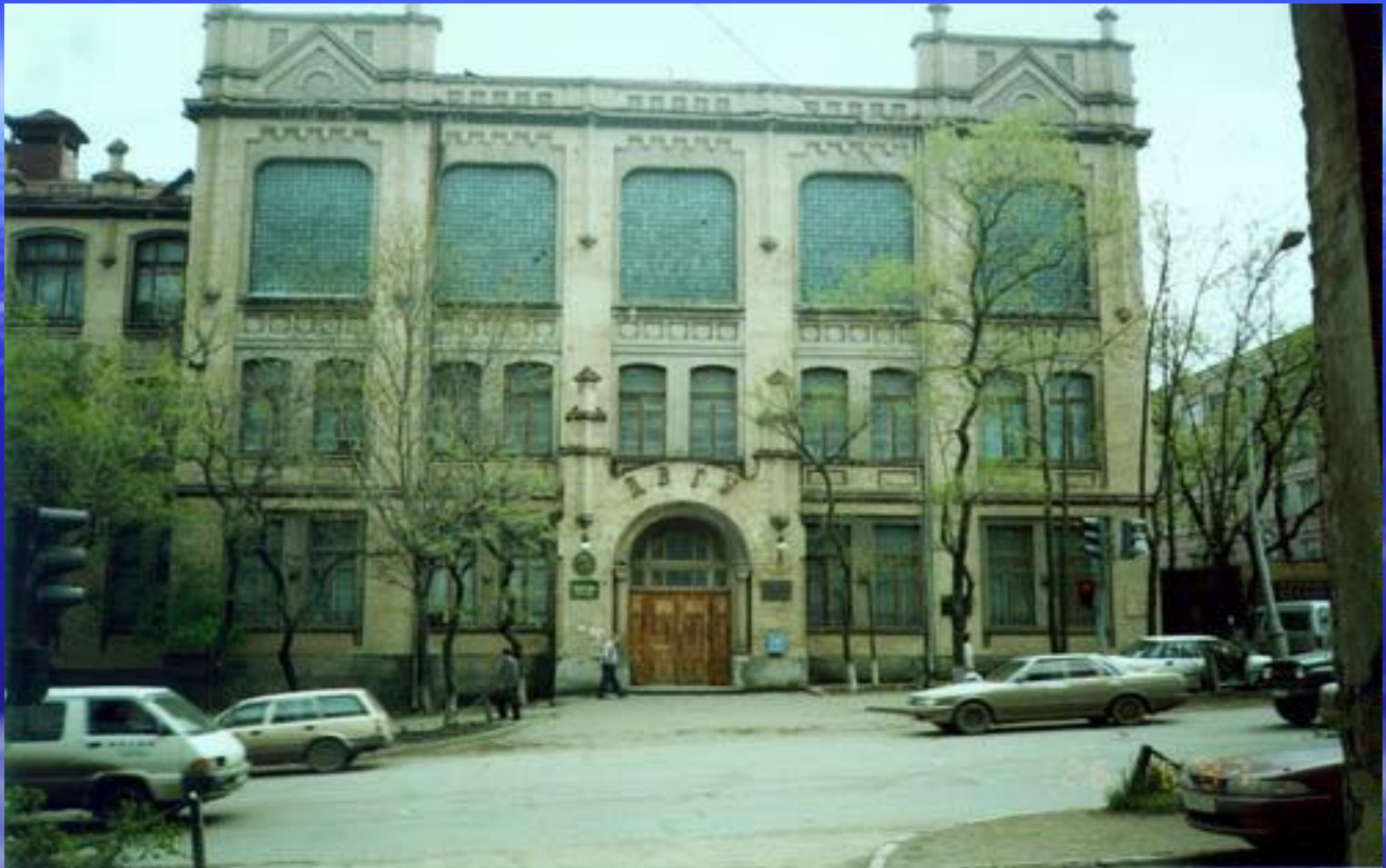
Дальневосточный Государственный Университет