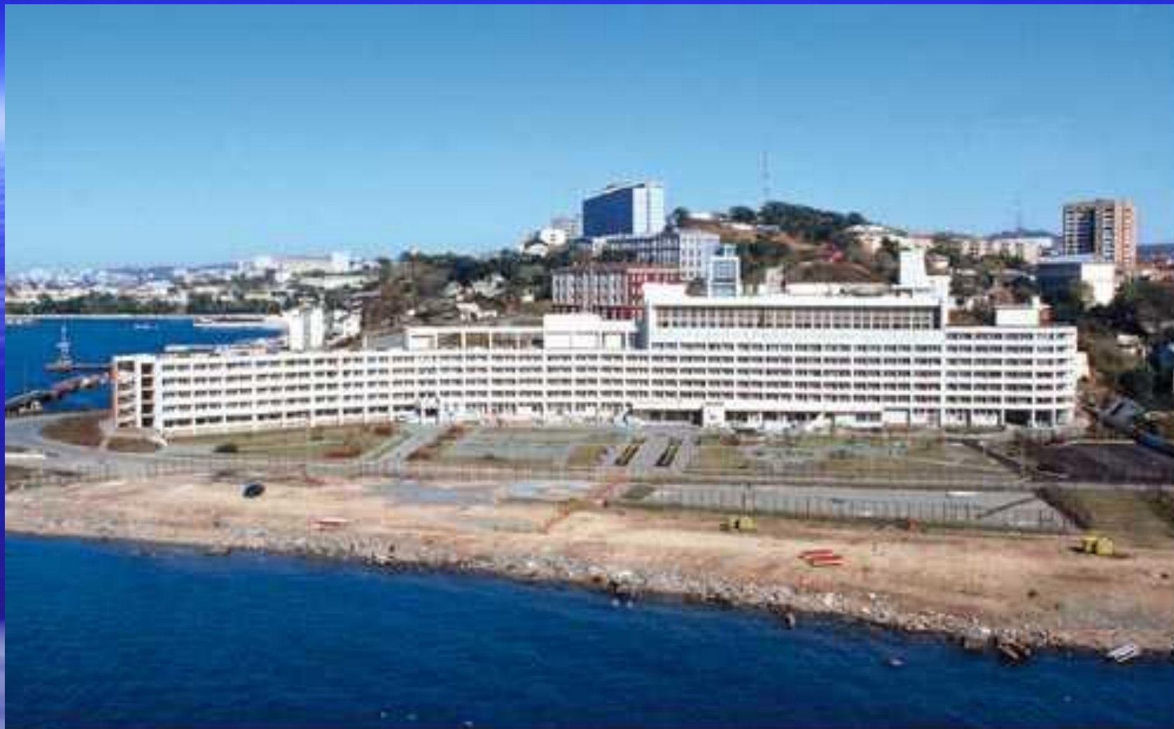
Гостиница «Амурский Залив».