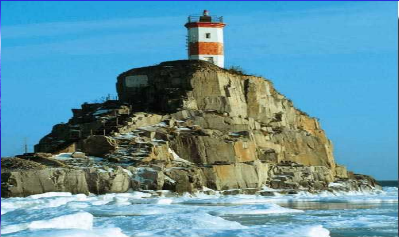
Маяк на острове Скрыплева в проливе Босфор Восточный.