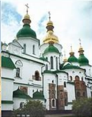
Собор Святой Софии, 1045 – 1050 гг., Украина, Киев