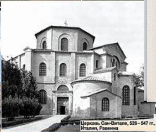
Церковь Сан-Витале, 526 – 547 гг., Италия, Равенна