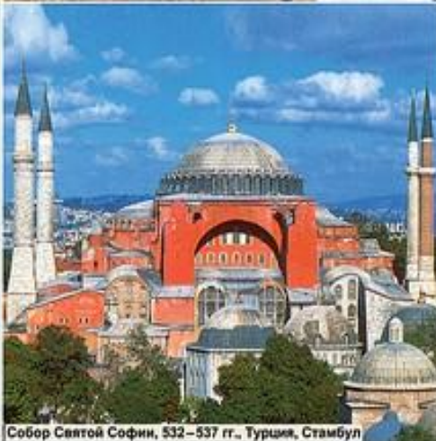
Собор Святой Софии, 532 – 537 гг., Турция, Стамбул