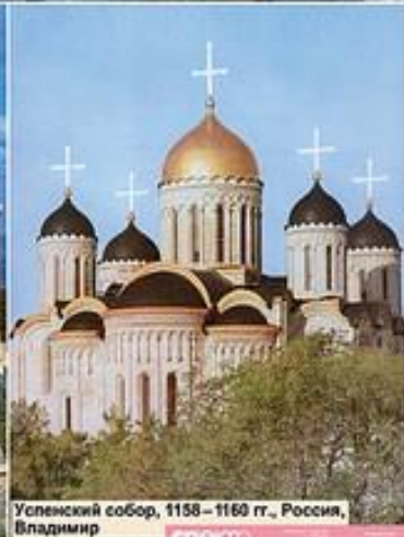
Успенский собор, 1158 – 1160 гг., Россия, Владимир