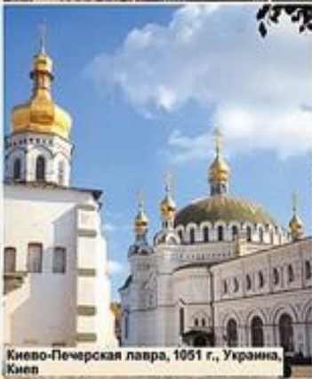
Киево-Печерская лавра, 1051 г., Украина, Киев