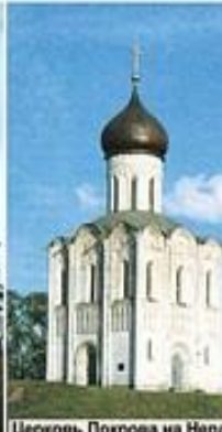
Церковь Покрова на Нерп, 1165 г., Россия, Владимир обл.